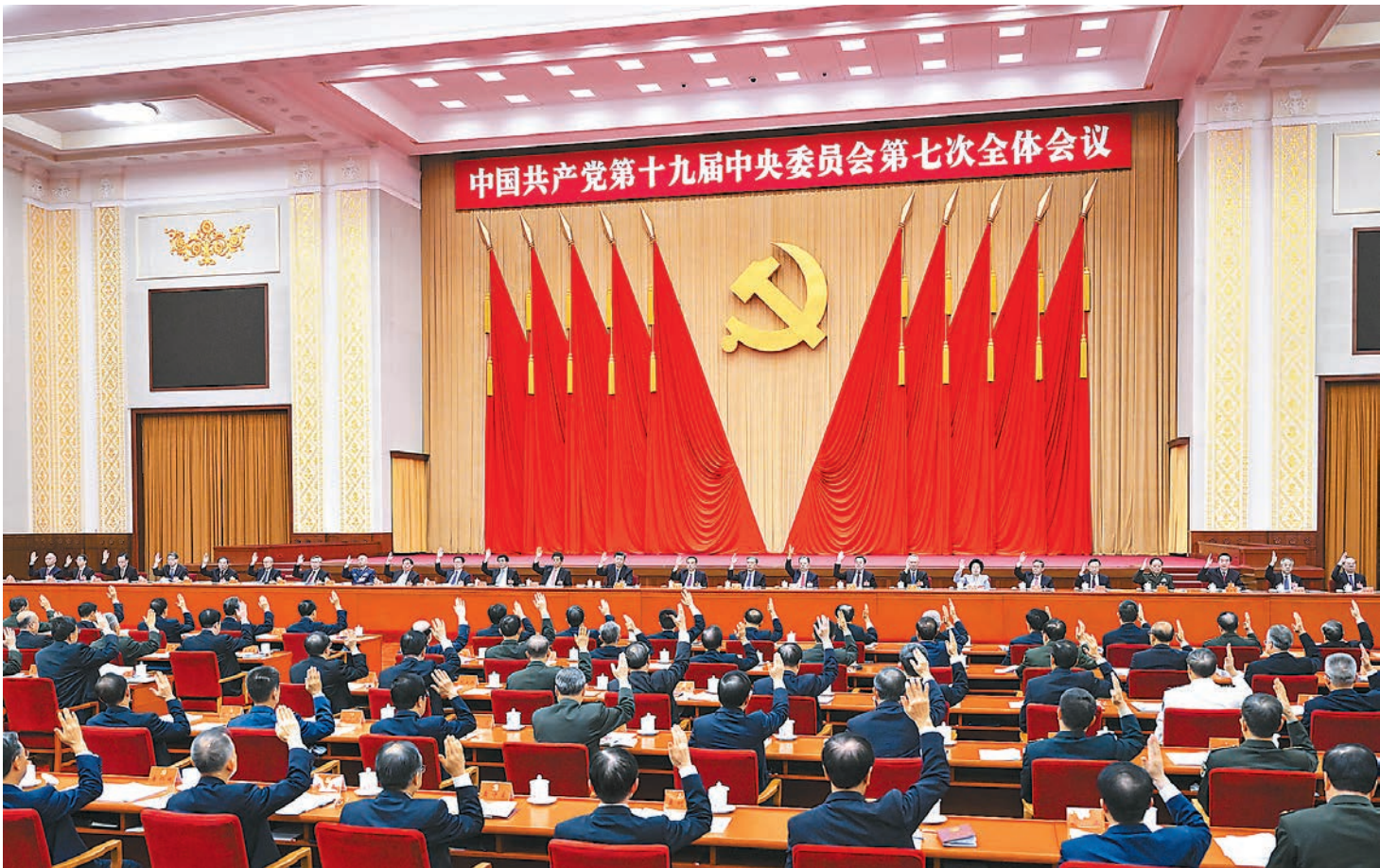
中国共产党第十九届中央委员会第七次全体会议，于2022年10月9日至12日在北京举行。中央政治局主持会议。