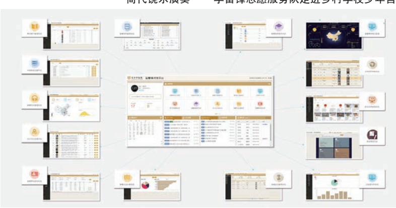
长沙市博物馆智慧博物馆系统分布