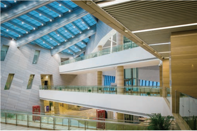
长沙市博物馆简洁现代的大厅

绘声绘色多频共振。 博物馆文化影响力的提升,得益于全媒体传播手段和数字化技术的发展。2015年新馆开放以来,通过创新“融媒体+”模式,探索多形态、多渠道、多元素的传播手段,借助湖南优质媒体资源广泛开展社会合作,与湖南金鹰955电台合作制作的“如果文物会说话·一日一物”系列持续播出300余期,荣获“2018中国广播创新融合品牌”奖。同时,从零开始倾力打造自媒体宣传矩阵,实现官方网站、官方APP、微博、微信、抖音和快手等多平台互通共振,截止到2022年12月,馆内各类自媒体平台共有关注用户85万人次,年度发布各类信息不少于1500条,近年来阅读总量均超8000万次,荣获2021年度中华文物全媒体传播精品(新媒体)入围奖,成为全国文博行业和湖南地区具有相当知名度的宣传矩阵。