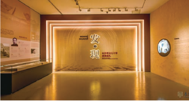
发·现——长沙考古七十年成果巡礼展厅