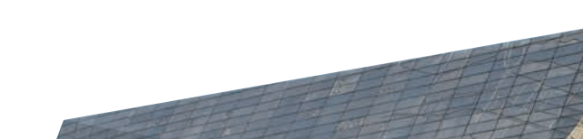
“地宫宝藏”特展首创“法门梦影”剧本游