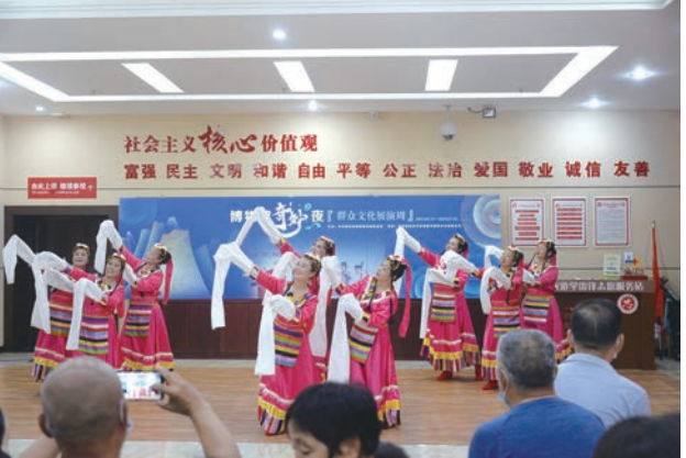
“奇妙夜活动”传统舞蹈展示

戏、民间工艺、宿州书画、灵璧奇石等博物馆基本陈列展厅外,宿州市博物馆还推出了优质的临时展览,如交流引进的“徽文化博物馆新安山水画展”“淮南市博物馆寿州窑瓷器展”“阜阳市博物馆书画展”和自办的“宿州百姓收藏展”“萧窑瓷器展”等,供游客参观。此外,对于精彩的展览和活动,宿州市博物馆利用微博、抖音等新媒体平台,在线为观众直播。讲解员根据留言,以实时互动的形式介绍观众感兴趣的展览。这些举措大大提高了“奇妙夜系列活动”的受众度和影响力,吸引了一大批年轻观众。