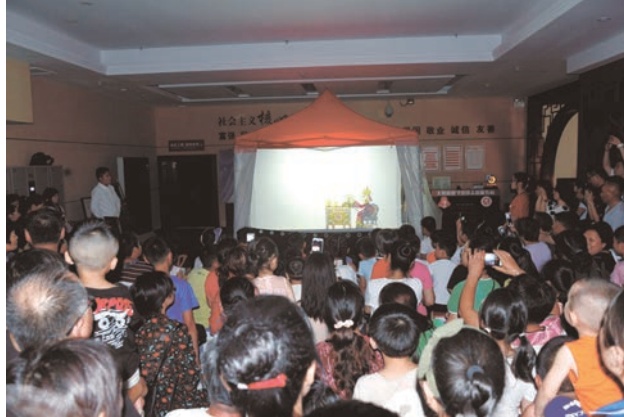
“奇妙夜活动”皮影戏专场表演

在宿州市博物馆一楼大厅举行的“奇妙夜系列活动”之文娱演出,一般时长为40分钟至60分钟。由宿州市博物馆党支部联合宿州市泗州戏剧团党支部、宿州市梆子戏剧团党支部、宿州市坠子戏剧团党支部以及宿州市管弦乐协会、埇桥区曲艺协会等社会团体发动组织专业演员、业余爱好者及非遗传承人等作为志愿者,义务为观众带来精彩的文娱