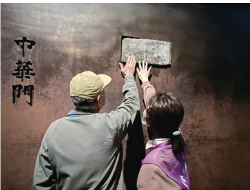
志愿者协助视障观众触摸中华门城砖

纪念馆开展党员“三个在一”工作法:一是党员亮身份,开展服务在一。纪念馆七个基层党支部轮班到观众参观一线,从预约答疑、便捷入馆、医疗救助、讲解教育等方面开展服务,提升观众入馆效率和参观体验,把观众需要的实事办在一。二是党员出实招,解决问题在一。夏天搭设遮阳棚,增添水雾风扇和防暑降温药品,针对老人、儿童、残障人士等特殊观众进一步优化绿色通道,以观众需求为导向发现问题,从软硬件方面出实招把