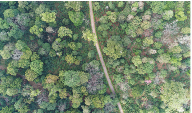
大坪掌古茶林

智慧的古茶林。景迈山古茶林在种植、养护等方面具有高超的生态智慧,以“林间开垦,林下种植”的茶林种植技术尤为突出。“林间开垦”指在森林间以村寨为中心斑块状开发古茶