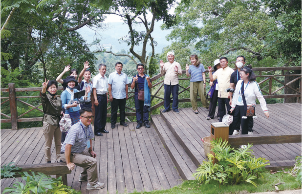
国际专家现场考察时无人机俯瞰分隔防护林

林、古茶林之间保留森林防护线或防护林。“林下种植”则指每片古茶林都保留大部分高大乔木,从而尽可能维系自然生态系统,中层种茶,地表保持草木层,从而形成“乔-灌-草”的立体群落结构。另外,在茶林养护上也多有技巧,他们在茶林中保留或栽植桂花树、多依树、樟脑树,其特有的香味会传递给茶叶,使茶叶具有天然的香气,而对茶树有害的那些树木则予以适当清除。