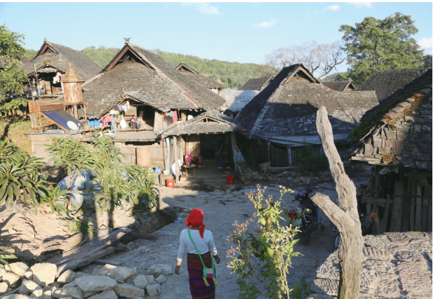
翁基民居