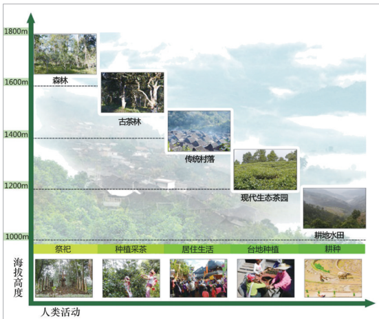
景迈山土地垂直利用示意图