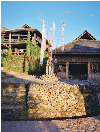
翁基寨心