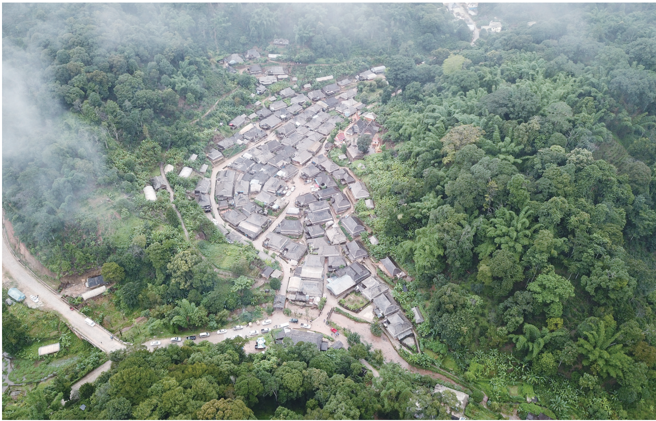
糯岗傣族村寨

此外,这种近似天然林的生态群落物种数和丰富度指数均明显高于林相相对单调的现代茶园。它特有的病虫害自我控制和土壤肥力自我维持的稳定、高效的生态系统是全球古老而独特的林下茶种植传统的杰出代表,也是人类早期茶种植模式的活化石。