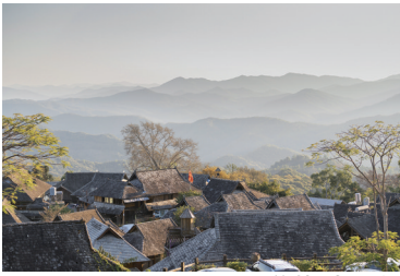
景迈山翁基