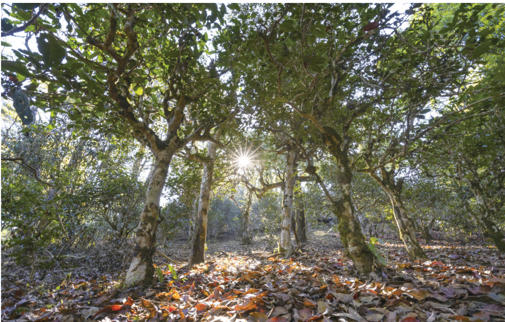
景迈大寨古茶林

普洱景迈山古茶林文化景观（简称“景迈山古茶林”）位于普洱市澜沧县惠民镇，总面积 191 平方千 米，其中，遗产区涉及景迈、芒景 2 个行政村，遗产要素由 9 个古村寨、5 片古茶林和 3 片分隔防护林组 成，主要居住着布朗族、傣族 2 个世居民族，人口 5200 多人。5 片古茶林面积达 1.8 万亩，共有古茶树 100 多万株。2023 年 9 月 17 日，景迈山古茶林文化景观通过联合国教科文组织第 45 届世界遗产大会 审议被列入世界遗产名录，实现了 13 年的申遗夙愿。对景迈山古茶林申遗历程进行回顾、工作经验进 行总结，保护策略予以研究，无疑对景迈山古茶林后申遗时代的可持续保护具有现实意义。