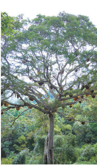
景迈山的蜂神树

现出遗产保护与经济社会协调发展的良好局面。五是各民族 文化自信进一步增强。景迈山世居民族共同创造、保护传承茶 文化，在申遗中增进了对景迈山古茶林生态智慧的认知，对民 族优秀传统文化的理解，对中国茶文化深厚底蕴和广泛影响的 了解，进一步强化了中华民族共同体意识和文化自信自强。