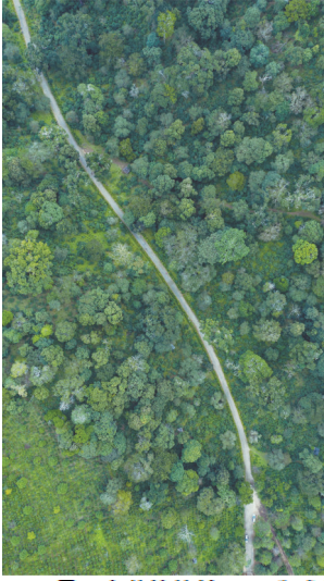
景迈山茶林航拍图