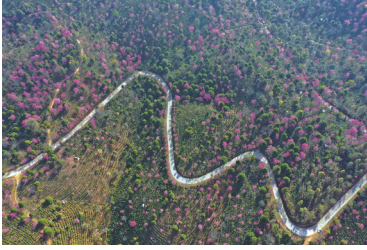
景迈山的樱花