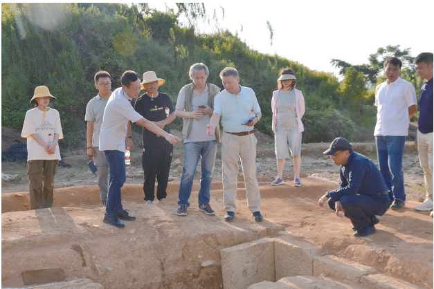
专家参观石构遗迹