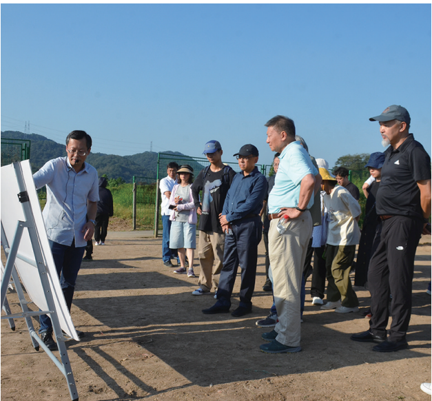
专家听取历年发掘介绍

例如宋高宗时期是否回归北方的政论,孝宗、光宗朝时期的礼制、国本之争等等。最后,展示利用工作可以从以下几个方面予以加强:如制作更为精确的三维模型;以龟头屋为线索,综合建筑实例、宋画、文献等相关素材,展示南宋建筑文化;以瓷器为线索,展示南宋礼制文化;吸引多学科力量参与南宋皇陵的学术、展示工作。