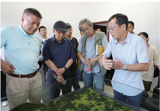
专家参观全景复原沙盘