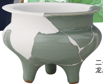
二号陵园出土 龙原窑鬲式炉