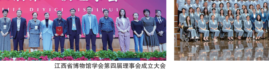
江西省博物馆学会第四届第一次理事会

新馆建构全新的“8+3”展陈体系,由8个常设展览和3个临时展厅构成,全景展现江西文化面貌,高质量满足新时代公众多元需求,阐释何以江西、讲好江西故事。常设展览立足江西,运用最新学术研究成果,以物证史、组合叙事,彰显江西文化的地域性和独特性,注重品牌打造的时代性和系统性。研究、教育、宣传等工作同步整体推进,还原一个真实立体完整的江西。临时展览立足时代,结合特色馆藏与学术热点,品牌化打造