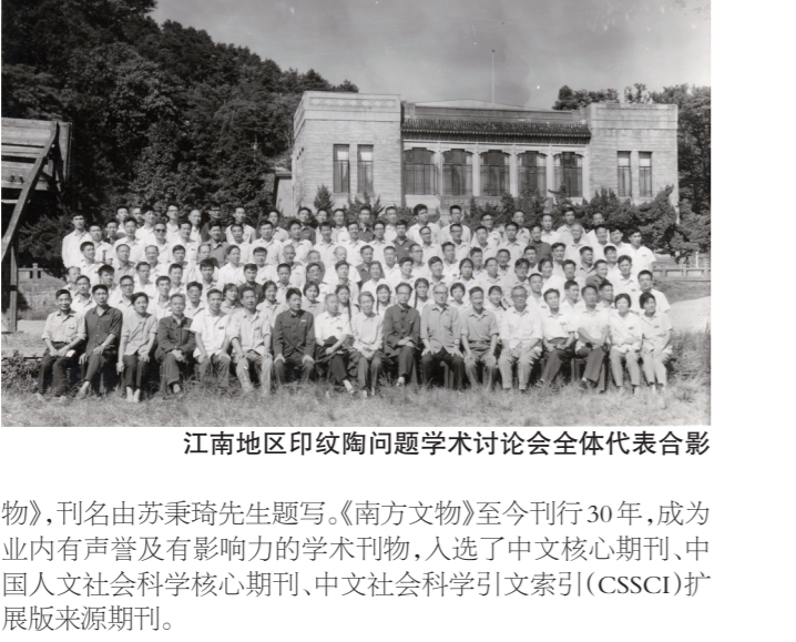
江南地区印纹陶问题学术讨论会全体代表合影