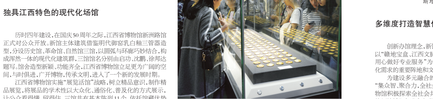
“海昏侯”展激发公众观展热潮

历时四年建设,在国庆50周年之际,江西省博物馆新洲路馆正式对公众开放。新馆主建筑借鉴明代御窑乳白釉三管窑造型,分设历史馆、革命馆、自然馆三馆,以圆弧与环廊巧妙结合,构成浑然一体的现代化建筑群。三馆馆名分别由启功、沈鹏、陈鹤达题写。馆舍造型新颖、功能齐全,江西省博物馆立足更为广阔的空间,与时俱进,广开博物,传承文明,进入了一个新的发展时期。