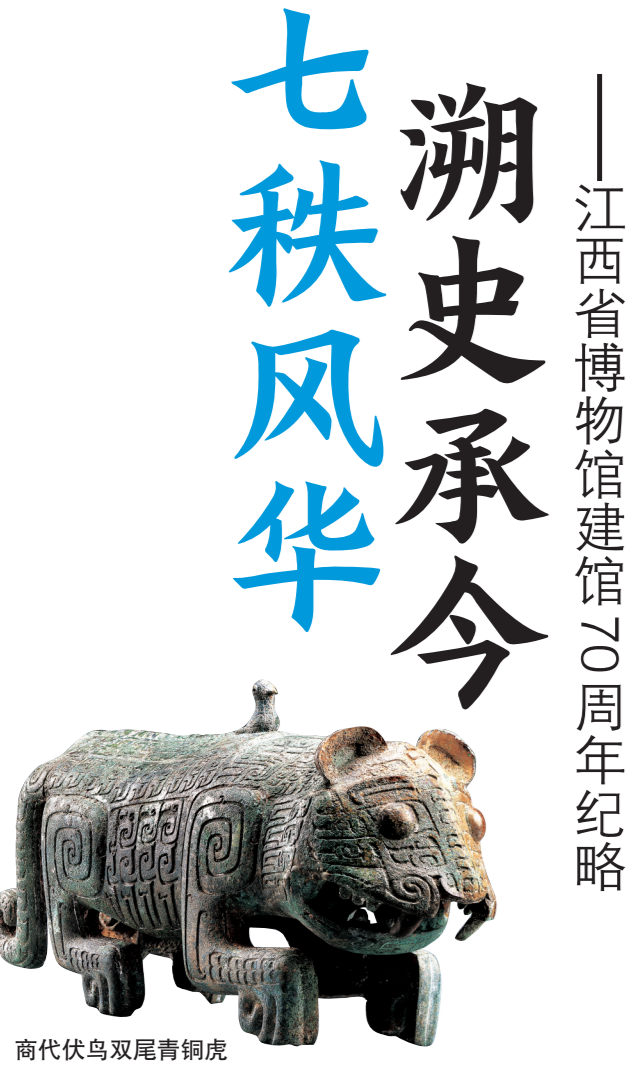
商代伏鸟双尾青铜虎