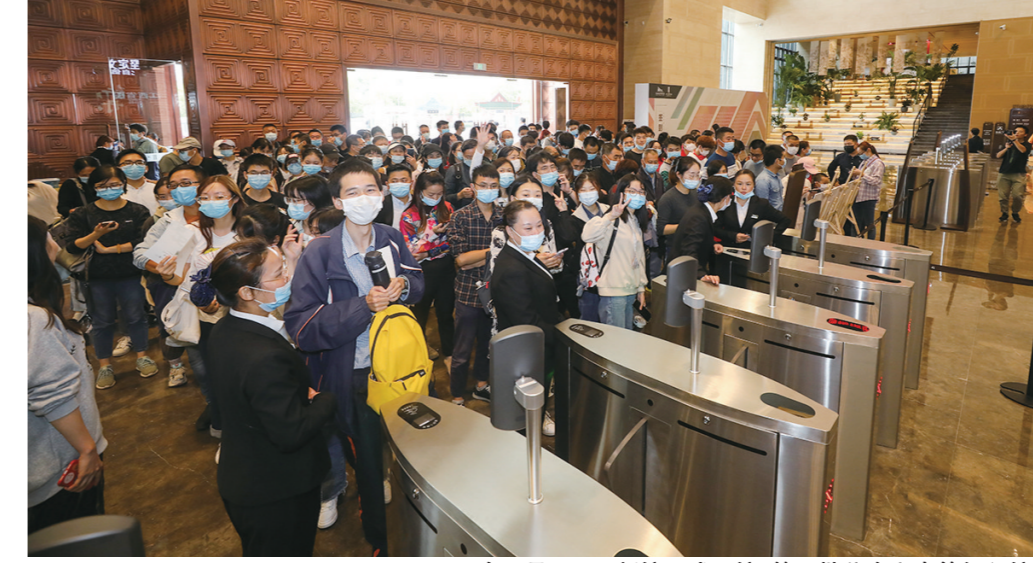
2020年9月27日,新馆正式开馆,第一批公众兴奋等候入馆