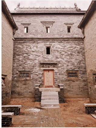
杨佩璋旧宅之绣楼