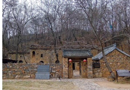
密县豫西抗日先遣支队司令部旧址