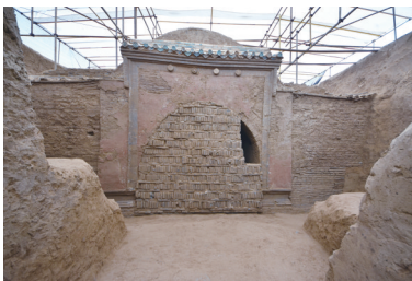
周懿王陵内側封门

河南省省级文物保护单位的公布,有利于进一步完善和优化文化遗产保护,切实提升河南文物基础保护管理水平,充分发挥文物在弘扬中国特色社会主义文化中的重要作用,有利于把丰富的文物资源优势切实转化为经济优势和发展优势,为河南省文旅文融合战略的实施提供坚强支撑。