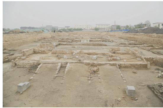
开封永宁郡王府遗址