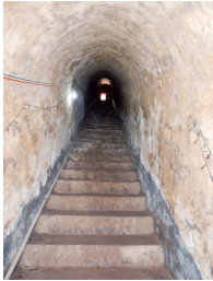
赵康王陵地宫入口