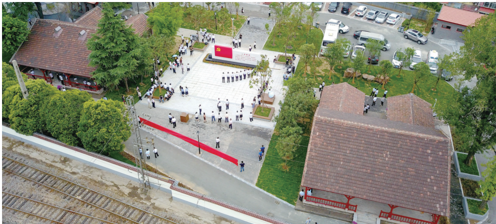
中共洛阳组诞生地