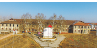
国营仪封园艺场旧址