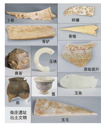
柴庄遗址出土文物