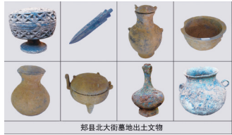
郑县北大街墓地出土文物