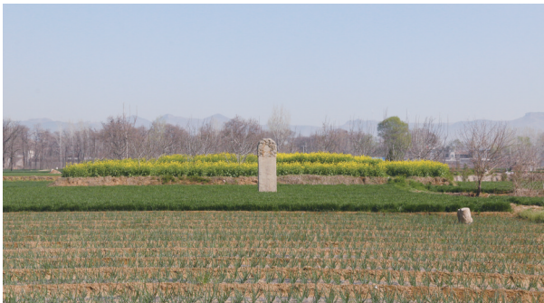
达鲁花赤哈剌鲁公墓