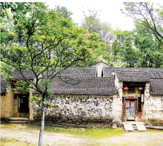
刘邓大军土门垌会议旧址