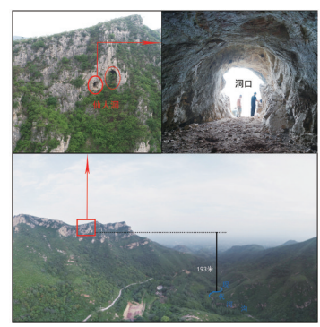
鲁山仙人洞航拍及洞内情况