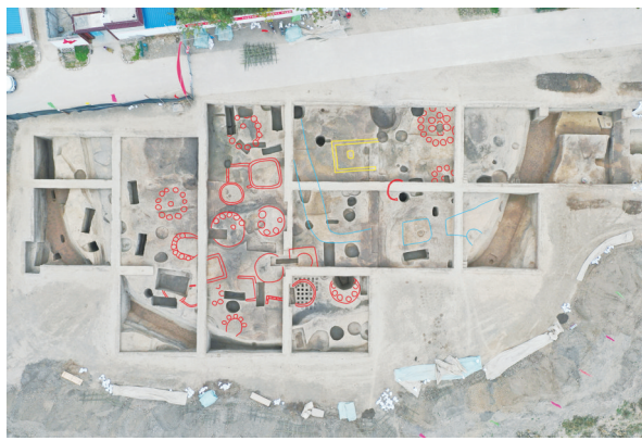
时庄遗址龙山末期仓储类遗存分布