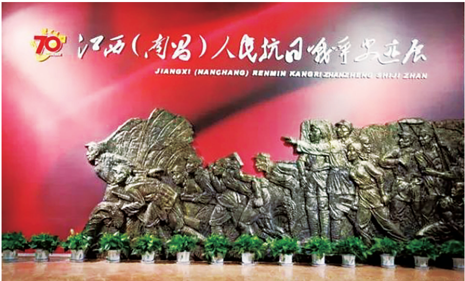
江西(南昌)人民抗日战争史迹展