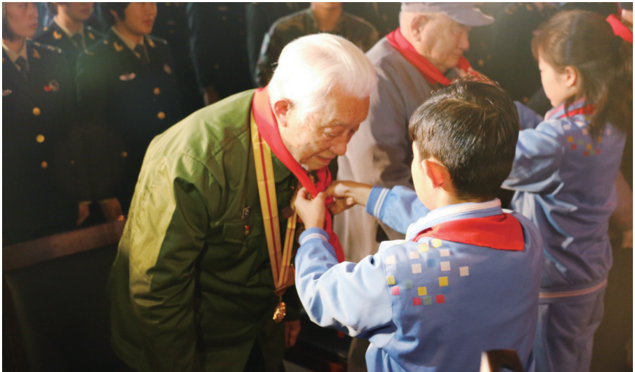
“新四军统战工作图片展”开展仪式上小学生为新四军老战士系上红领巾