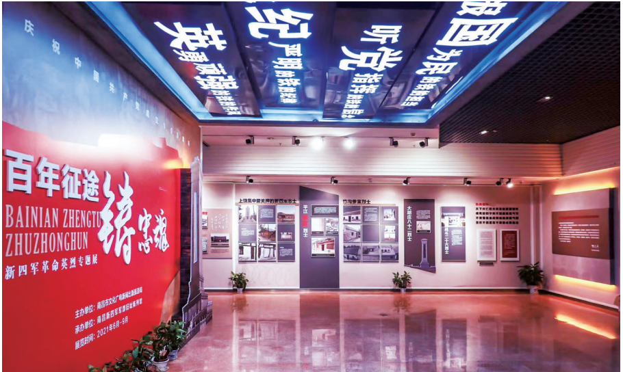
百年征途铸忠魂——新四军革命英烈专题展