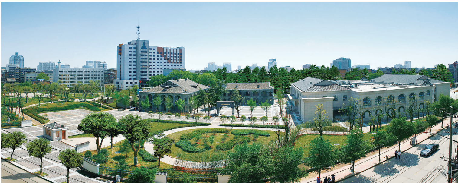
南昌新四军军部旧址陈列馆