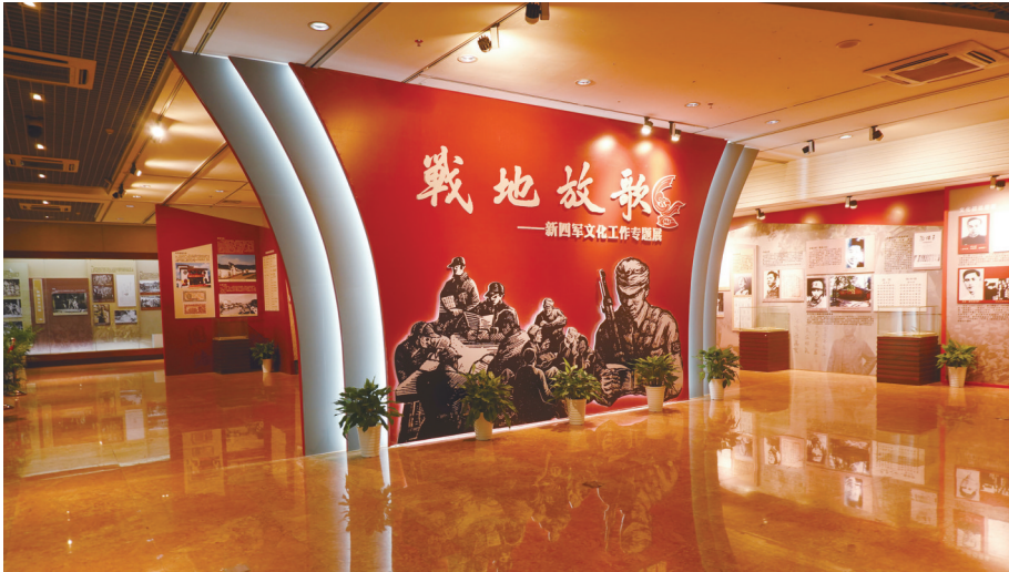
战地放歌——新四军文化工作专题展