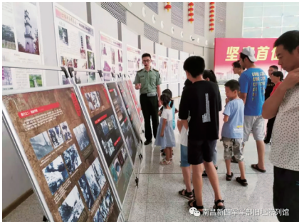
“江西(南昌)人民抗日战争史迹展”巡展中