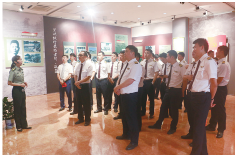
飞行员团体参观“新四军党建工作图片展”