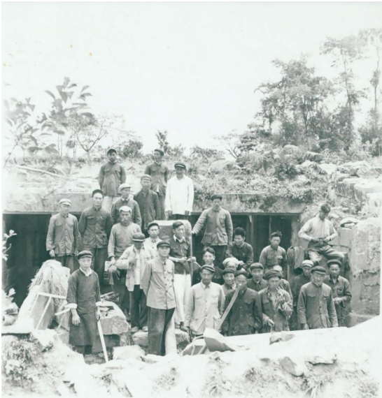
1957年，发掘工作人员在杨黎墓前合影