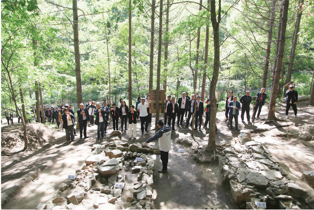
红石砬子抗日根据地遗址公众考古活动