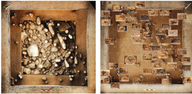
2023年和龙大洞遗址出土化石分布图

红砬子抗日根据地遗址小姚家沟、二趟沟、石人沟区域开展考古发掘工作，发掘总面积1500平方米。主要以武器、生产工具、生活用具为主。经考古发掘得知，红砬子遗址内四类遗存及整体防御体系基本相同，由明暗哨、居住区、转移区、战斗区组成。