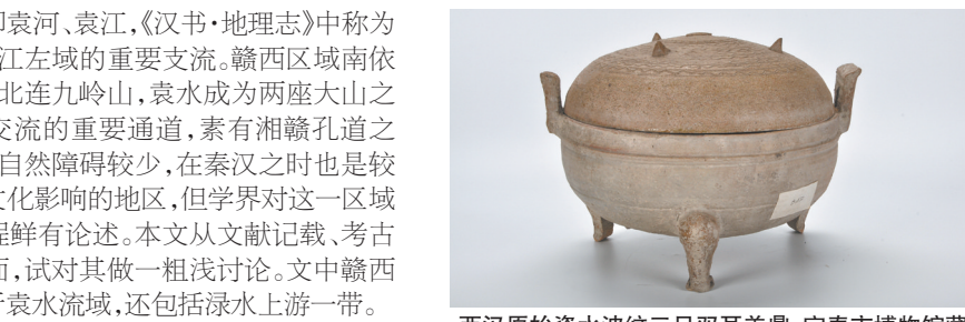
西汉原始瓷水波纹三足双耳鼎 宜春市博物馆藏