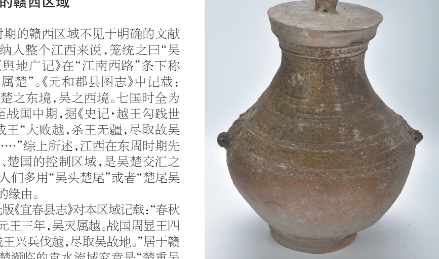
西汉原始瓷水波纹铺首带盖壶 宜春市博物馆藏

袁水即袁河、袁江，《汉书·地理志》中称为南水，是赣江左域的重要支流。赣西区域南依罗霄山脉，北连九岭山，袁水成为两座大山之间东西向交流的重要通道，素有湘赣孔道之称，这一带自然障碍较少，在秦汉之时也是较早接受汉文化影响的地区，但学界对这一区域汉化的进程鲜有论述。本文从文献记载、考古发现等方面，试对其做一粗浅讨论。文中赣西区域略大于袁水流域，还包括袁水上游一带。 先秦时期的赣西区域 先秦时期的赣西区域不见于明确的文献记载，一般纳入整个江西来说，笼统之曰“吴头楚尾”。《舆地广记》在“江西南西路”条下称“春秋战国属楚”。《元和郡县图志》中记载：“春秋时为楚之东境，吴之西境。七国时全为楚地。”又至战国中期，据《史记·越王勾践世家》载，楚威王“大败越，杀王无疆，尽取故吴地至浙江……”综上所述，江西在东周时期先后是吴、越、楚国的控制区域，是吴楚交汇之地，这就是人们多用“吴头楚尾”或者“楚尾吴头”来概括的缘故。 清道光版《宜春县志》对本区域记载：“春秋时属吴，周元王三年，吴灭属越。战国周显王四十六年楚威王兴兵伐越，尽取吴故地。”居于赣江以西、与楚濒临的袁水流域究竟是“楚重吴轻”还是“吴重楚轻”？根据文献记载以及考古资料，吴（越）文化主要分布于赣北赣东一带，典型吴越器物发现区域较西的也仅是原清江县，至于袁水腹地未见发现。反观楚文化，有学者认为战国时期楚文化东进的一条线路是由湖南经萍乡、宜春、顺袁江而下进入赣腹地。二者对比分析，战国时期袁水之域楚文化影响应重于吴（越）。诸如位于渌水河畔的田中古城废弃，有学者认为，其与楚昭王南侵百越有关。位于袁水汇入赣江口东岸的国字山越王室大墓，有可能是越势力控制的西陲，隔赣江与楚相抗的前线。 秦汉时期赣西区域的行政设置 秦统一后，分天下为三十六郡。今赣西萍乡、宜春等地由长沙郡管辖。汉初，设立宜春一县，其域界据道光三年《宜春县志》载：“今考其地，西至插岭（今醴陵县界），东至百华台，即临江府东一里。”这一记载明确，宜春县不仅管辖袁水流域，也包括了渌水上游一带。宜春县也即为赣西区域的较早行政设置，可追溯到汉高帝六年（前201），置宜春县，治所今宜春市。关于汉初宜春县归属，有两种说法：一是豫章郡说。《汉书地理志》：豫章郡领有宜春县。《太平寰宇记》：宜春县“汉旧县也，属豫章郡。高帝六年灌婴于此筑城置宜春县。”《舆地纪胜》：袁州“汉高帝六年分九江置豫章郡，今按《汉志》豫章郡所统十八县，宜春预焉。”同治《宜春县志》：“《西汉高帝四年分九江置豫章郡，始置宜春县》。”二是长沙国说。《王子侯表三上》又载：“宜春侯成，长沙定王子”，武帝元光六年（前129）“七月乙巳封，十七年，元鼎五年，坐酎金免。”《水经注》：宜春县“汉武帝元光六年，封长沙定王子刘成为侯国。”正德《袁州府志》：“元