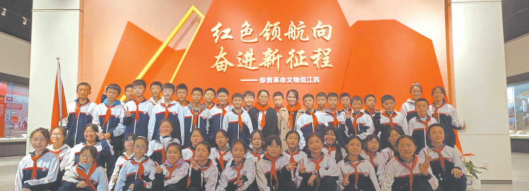
宜春四中学生在“红色领航向 奋进新征程——珍贵革命文物说江西”展厅开展主题队日活动

近年来，宜春市博物馆始终将深挖红色资源、厚植红色底蕴作为工作主线，以红色文化展览为主阵地，坚持将传承红色基因，赓续红色血脉的文化使命贯彻落实在展览的策划和服务工作当中。 以关键节点为导向，推出红色主题临展。在庆祝中国共产党成立100周年，党史学习教育深入开展之际，策划推出“风展红旗如画——庆祝中国共产党成立100周年特展”；在2022年元旦和春节期间，联合南昌金九福钱币博物馆推出“熔铸初心——江西革命根据地红色货币展”；在共和国73周年华诞之际，联合中国文物报社、中国人民革命军事博物馆举办“红色百年——全国革命文物图片选萃展”；在党的二十大召开前夕，联合江西省博物馆推出“红色领航向 奋进新征程——珍贵革命文物说江西”；在推进主题教育走深走实期间，联合江西省革命烈士纪念馆策划推出“最闪亮的坐标——江西英模人物事迹展”。 这些临展，或通过馆藏革命文物和珍贵的历史档案客观再现宜春地区红色革命历程，或借借省级馆精品文物聚焦赣鄱大地发生的沧桑巨变，或引进国家级文物平台交流展再现中国共产党百年奋斗的恢宏篇章。虽然展览的策展角度、展示重点和叙事逻辑各不相同，但讲述革命文物背后的动人故事，讲述中国共产党波澜壮阔的奋斗历程、讲述中国共产党人的初心使命始终贯穿其中。通过系列策划、定期推出、持续打造，宜春市博物馆成为当地市直机关和企事业单位开展革命传统教育和主题党日活动的重要阵地，成为各中小学培育和践行社会主义核心价值观的生动课堂，年均接待参观学习团体近100批次，服务青少年主题队日和研学活动7万余人。为弘扬革命文化、传承红色基因，坚定文化自信，汲取奋进力量起到积极作用。 以文化惠民为导向，推出红色流动展览。在积极主动呼应社会主旋律的同时，宜春市博物馆红色主题展览还以丰富广大民众精神文化生活为首要。为进一步彰显公共文化服务为民惠民便民的理念，宜春市博物馆坚持就近就便原则，因势利导利用流动展陈形式，导引公众参观学习。近年来，先后将“星火燎原 光辉起点——湘赣边区革命文物联展”“风展红旗如画——庆祝中国共产党成立100周年特展”“方寸间铭记光辉历程——中国共产党成立100周年纪念邮票展”“弘扬社会主义核心价值观主题宣传展”“红色百年——全国革命文物图片选萃展”“新征程 再出发——深入学习宣传贯彻党的二十大精神”等多个紧贴时代脉搏、弘扬社会主旋律的流动展览送到企业、校园和乡镇、社区的新时代文明实践中