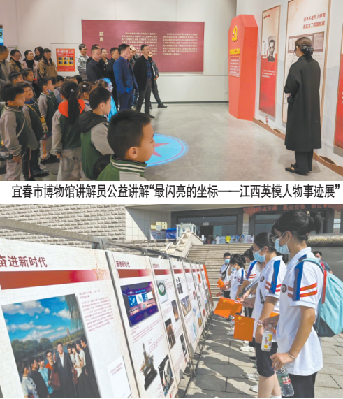
宜春市博物馆讲解员公益讲解“最闪亮的坐标——江西英模人物事迹展”

近年来，宜春市博物馆始终将深挖红色资源、厚植红色底蕴作为工作主线，以红色文化展览为主阵地，坚持将传承红色基因，赓续红色血脉的文化使命贯彻落实在展览的策划和服务工作当中。 以关键节点为导向，推出红色主题临展。在庆祝中国共产党成立100周年，党史学习教育深入开展之际，策划推出“风展红旗如画——庆祝中国共产党成立100周年特展”；在2022年元旦和春节期间，联合南昌金九福钱币博物馆推出“熔铸初心——江西革命根据地红色货币展”；在共和国73周年华诞之际，联合中国文物报社、中国人民革命军事博物馆举办“红色百年——全国革命文物图片选萃展”；在党的二十大召开前夕，联合江西省博物馆推出“红色领航向 奋进新征程——珍贵革命文物说江西”；在推进主题教育走深走实期间，联合江西省革命烈士纪念馆策划推出“最闪亮的坐标——江西英模人物事迹展”。 这些临展，或通过馆藏革命文物和珍贵的历史档案客观再现宜春地区红色革命历程，或借借省级馆精品文物聚焦赣鄱大地发生的沧桑巨变，或引进国家级文物平台交流展再现中国共产党百年奋斗的恢宏篇章。虽然展览的策展角度、展示重点和叙事逻辑各不相同，但讲述革命文物背后的动人故事，讲述中国共产党波澜壮阔的奋斗历程、讲述中国共产党人的初心使命始终贯穿其中。通过系列策划、定期推出、持续打造，宜春市博物馆成为当地市直机关和企事业单位开展革命传统教育和主题党日活动的重要阵地，成为各中小学培育和践行社会主义核心价值观的生动课堂，年均接待参观学习团体近100批次，服务青少年主题队日和研学活动7万余人。为弘扬革命文化、传承红色基因，坚定文化自信，汲取奋进力量起到积极作用。 以文化惠民为导向，推出红色流动展览。在积极主动呼应社会主旋律的同时，宜春市博物馆红色主题展览还以丰富广大民众精神文化生活为首要。为进一步彰显公共文化服务为民惠民便民的理念，宜春市博物馆坚持就近就便原则，因势利导利用流动展陈形式，导引公众参观学习。近年来，先后将“星火燎原 光辉起点——湘赣边区革命文物联展”“风展红旗如画——庆祝中国共产党成立100周年特展”“方寸间铭记光辉历程——中国共产党成立100周年纪念邮票展”“弘扬社会主义核心价值观主题宣传展”“红色百年——全国革命文物图片选萃展”“新征程 再出发——深入学习宣传贯彻党的二十大精神”等多个紧贴时代脉搏、弘扬社会主旋律的流动展览送到企业、校园和乡镇、社区的新时代文明实践中