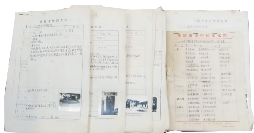
渝中区“二普”工作调查表

徐晓渝感叹，时不我待，“四普”可能是他参与的最后一次文物普查工作，但“功成不必在我，功成必定有我，必须一茬接着一茬干。”言语间，表达了对新一代的文物工作者的希冀，希望他们不负时代、不负使命肩负起新时代文物工作者的责任与担当。就新一代文物工作者如何开展“四普”工作，三位所长给出了自己的建议：一要坚持