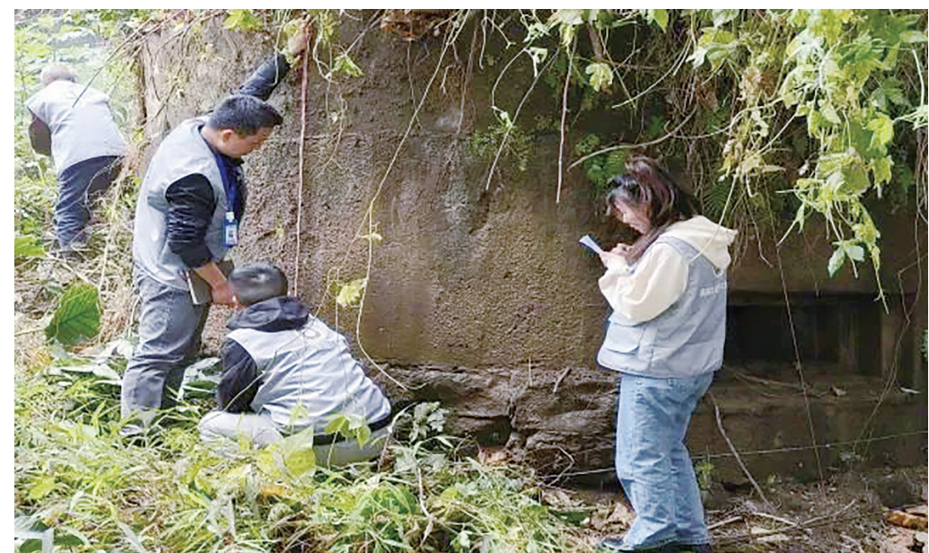
普查队员开展野外调查工作

唐嵩介绍，为持续提高市民的积极性，营造普查良好氛围，渝中区文管所四普试点期间制作宣传横幅16条，海报100张，在街道、社区、群