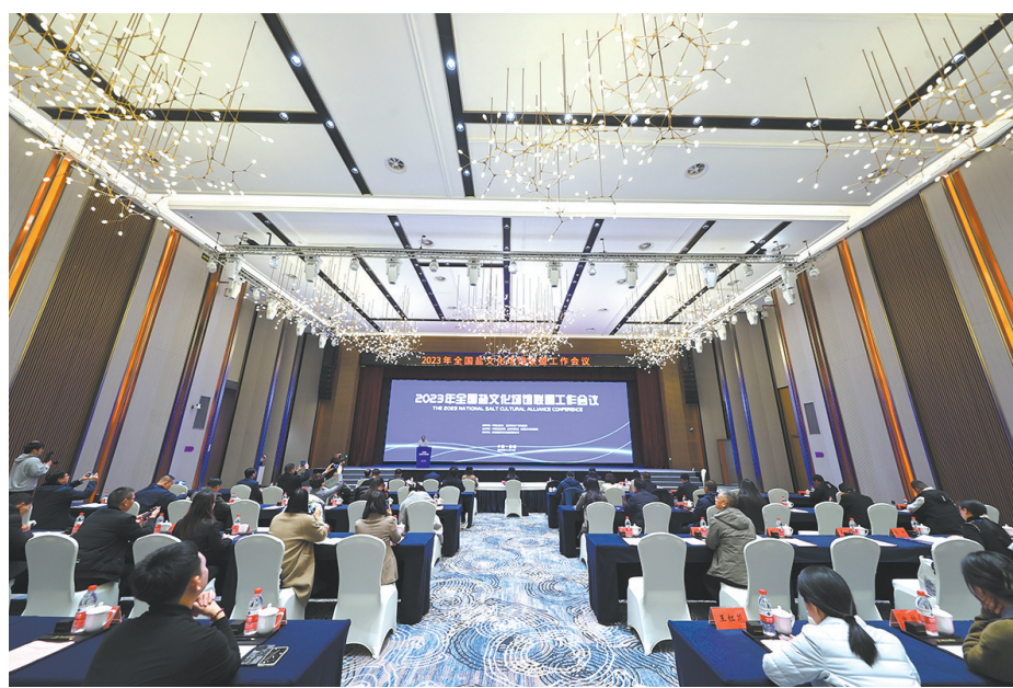
全国盐文化场馆联盟大会

2024年,联盟将重点在陈列展览、学术研究、藏品征集、文化创意、国际交流等方面开展工作,努力形成一批“最盐”学术成果,以更高的站位、更宽的视野推进全国盐文化场馆资源共享、共同发展,努力开创盐文化场馆联盟事业更加广阔、更有活力的发展局面,保护好中国盐文物、传承好中国盐文化、传播好中国盐故事。