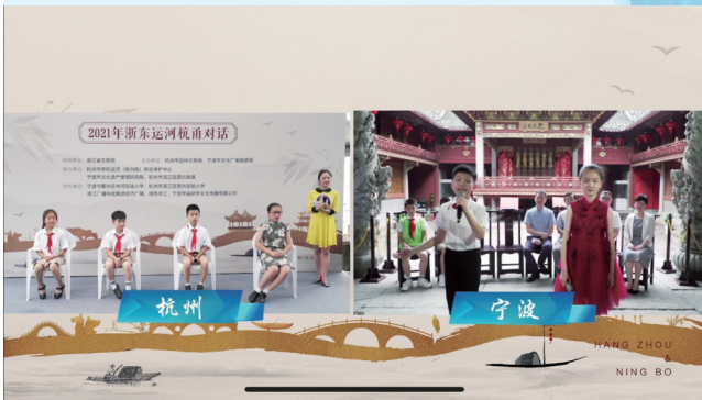
2021年6月14日,第一届杭甬对话活动