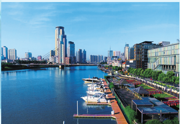
宁波三江口外滩沿岸