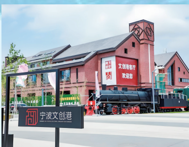
宁波文创港港埠三区