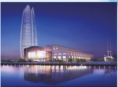
工业遗存宁波渔轮厂重装升级为文旅演艺综合体