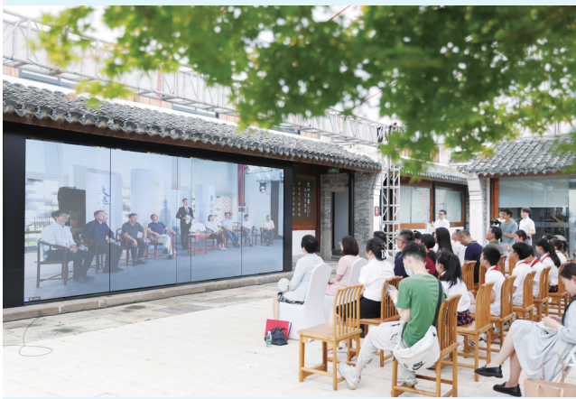
2023年6月21日,第三届杭甬对话活动