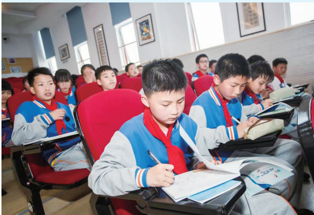
大运河文化进校园