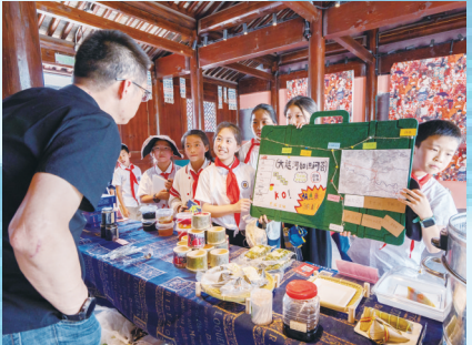
行走大运河实地研学