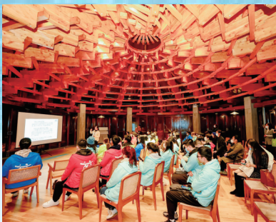
杭甬两地大学生线下研学行走活动