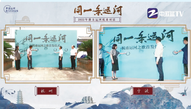
2022年6月22日,第二届杭甬对话活动