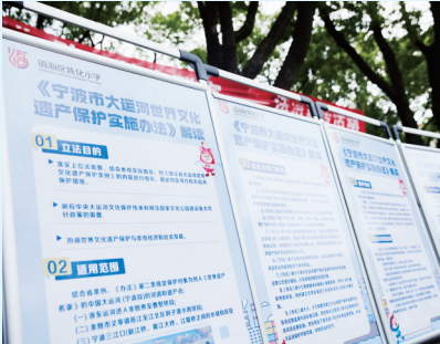
小河长护河行动-立法宣传

在保护方面，宁波循序推进运河沿线古镇古村的复兴和名人故居、水利航运设施的修缮养护，改善沿线田园风光与郊野风貌。加强数字赋能，强化大运河宁波段文化遗产监测预警平台的“用武之地”，完善以无人机智能巡查为主要方式的陆空互补、纵横成网的巡查体系。通过数据的紧密对接和互通互用，建立起“预警及时、防治到位”的动态管控长效机制；同时，以强化针对性、精准性和可操作性为目的，加强宁波运河遗产研究力度，完成大运河宁波段遗存保护修复和文化价值研究传承、“一带一路”和大