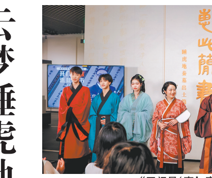
“开门见喜”惠此简书”现场直播活动

坚持人才领先,打造人才辈出大舞台。博物馆业为战略性新兴产业发展新质生产力提供全科型、高层次的文博人才支撑。今年,山东省印发《文博全科人才定向培养实施办法》,提出定向培养约300名文博全科人才,明确招生录取、定向培养等政策措施;重庆中国三峡博物