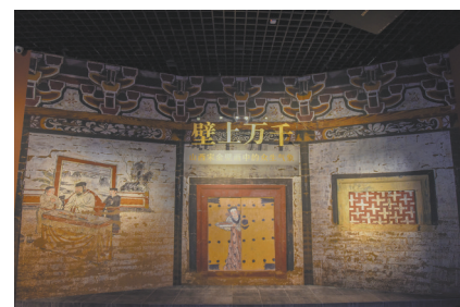
“壁上万千”展览序厅