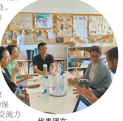
代表团在布达佩斯历史博物馆会谈