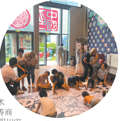
参观巴黎中国文化中心

为加快创建“中国特色世界一流博物馆”，四川博物院将着眼长远，与强有力的当地合作者建立稳固的长期合作关系，并在合作中考虑对方的利益关切，注重长效合作，使他们成为推动中华文化“走出去”的重要力量。