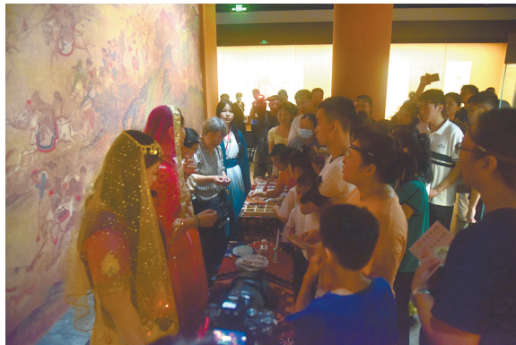
“草原之夜”特色市集活动