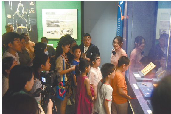
“草原之夜”讲解导赏

沉浸式体验、探索式美育、创新性活动 琴音悠扬,传承不息。青岛市博物馆携手青岛张薇诸城派古琴艺术交流中心举办2024年“博琴雅韵”古琴公益班、诸城派古琴单曲班系列课程。从基础乐理知识到古琴弹奏技巧的全面学习,满足来自各行各业古琴爱好者的学习需求。暑期古琴提高班开班,让更多的人了解并喜欢上古琴艺术,让古琴的泠泠之音响彻四方。