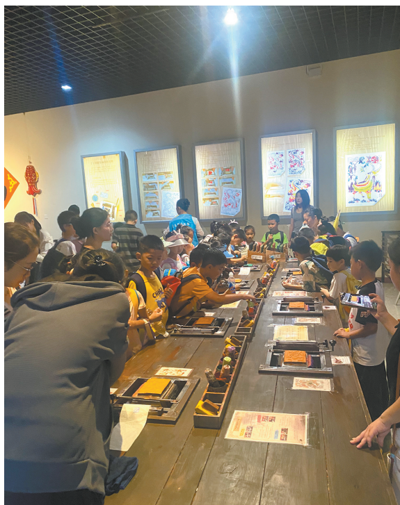
木版年画制作体验活动

暑期在展的“五月的风——纪念五四运动105周年展”,以图文并茂的形式,让观众深刻感受到历史的真实面貌和革命先烈英勇无畏的奉献精神,展览已开展三个月,但热度依旧不减,连续四个月入选“全国100家博物馆的100个热门展览”。“我们还把展览搬到线上,以流动展的方式走进青岛书城、海军潜艇学院等单位,不断拓宽展览展示渠道,提升展览参与度,受到观众的好评,取得了良好的社会效益。”策展人介绍道。