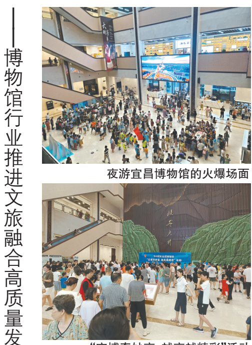
夜游宜昌博物馆的火爆场面

正当暑期,“博物馆热”势不可挡地袭来,许多博物馆陆续取消“预约”机制,顺应观众的参观需求。试想酷暑难耐之际,大批观众兴致勃勃地奔向博物馆,临到门口发现没有预约,还须在室外高温炙烤下拨弄手机现场预约,体验实属不佳。所以,不应让预约制将博物馆为公众免费开放带来的幸福指数降低,无需预约,“一张有效证件即通关”等举措直击痛点,包括“外国人永久居住证”的国外观众也与中国公民同样拥有刷卡即入的便捷。当然,部分超火爆的博物馆仍然要用预约制分时段控制场馆的最高观众承载量,以保障游客人身和文物的安全。