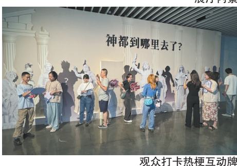
观众打卡热梗互动牌