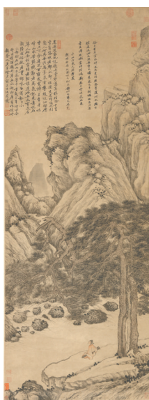
虎丘送客图 明 沈周

主办单位:北京市文物局 承办单位:首都博物馆 故宫博物院 中国国家博物馆 清华大学艺术博物馆 辽宁省博物馆 天津博物馆 安徽博物院 浙江省博物馆 苏州博物馆 无锡博物院 扬州博物馆 镇江博物馆 沈阳故宫博物院 中国美术学院美术馆 江苏省美术馆 江苏省现代美术馆 北京市文物交流中心 北京画院 展出地点:首都博物馆展厅2.3层 展期:2024年10月1日至2025年1月6日