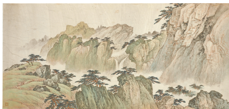
刘子久 山水图卷 天津博物馆藏

展览汇集了河北博物院、吉林省博物院、首都博物馆、天津博物馆馆藏“京津画派”137件绘画精品,分为“提倡风雅 保存国粹”“精研古法 博采新知”“传承画范 复古更新”三个部分。第一部分展示了京津画派对传统文化的坚守与传承。第二部分介绍了京津画派成员在古法基础上的创新尝试。第三部分呈现了京津画派在新时代背景下的传