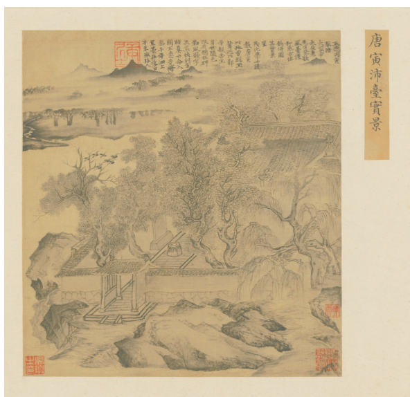
四朝选藻贞册-唐寅 沛台实景图