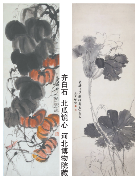
启功 墨莲图轴 吉林省博物院藏

承与发展。通过系统梳理和分类展示,让观众深入了解京津画派的艺术造诣和推动中国画发展的深远影响,同时感受其守护国粹的民族精神。