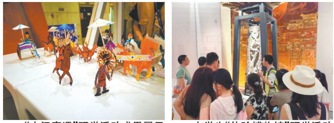
“大汉奇遇”研学活动成果展示

开放融合,让博物馆专家“走出去”,把教育名家“请进来”。重庆中国三峡博物馆长期开展系列讲座和教学活动等公众教育活动。馆长带头在重庆大学担任课程教授,参与大学相关专业的建立与授课;文物研究专家分别走进四川美术学院、重庆工商职业学院、重庆艺术职业学院担任课程教授,送讲座进校园;专业教育走进新丝路小学、中华路小学等担任社团课教师,校外辅