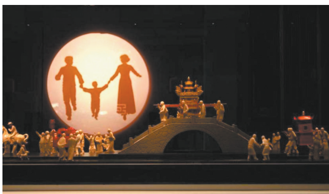
“送亲队伍”木雕模型

雄关漫道真如铁,而今迈步从头越。在新时代,革命纪念馆讲解员应认真对照“五好”讲解员的要求,在思想上“补钙”,在知识上“淬火”,在讲解上“升级”,在示范上“提质”,努力肩负起强复兴的历史使命,成为一名新时代合格的革命纪念馆讲解员。