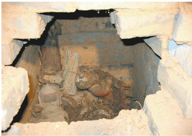
暗龕开启时文物堆放情况

2004年,从千年宋塔慈云寺塔出土了一批晚唐五代至北宋初期的宗教及世俗文物,有大量的纸本画、经卷、雕塑等,展现了唐宋赣州的市井生活和唐宋气派。考古学泰斗宿白先生认为:“这批东西太重要了。”著名纺织考古学家王亚蓉评价:“这批文物不管人文的、历史的、艺术的价值都非常重要,这是赣州人民的福分。”