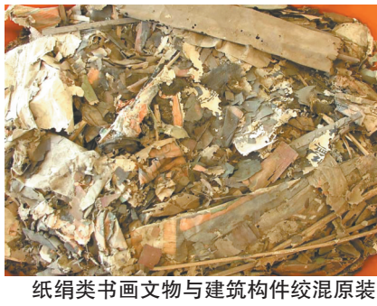
纸绢类书画文物与建筑构件混装