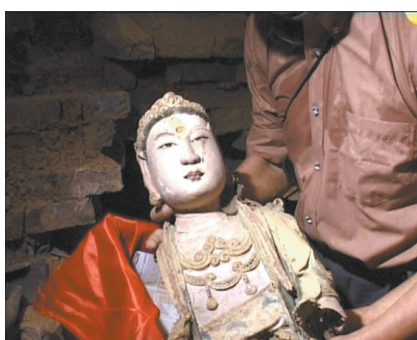
考古人员紧急抢救性清理

2004年5月26日,慈云寺塔内壁画大修时,在第四层塔心西北面内壁发现一个面宽55厘米、进深33厘米、高117厘米的暗龕,龕内零乱地堆满了严重破损的书画经卷、佛教造像等文物。工作人员随即向赣州市文物主管部门报告,市文物局(博物馆)当即组织考古专家成立紧急清理小组,对暗龕内藏匿的文物进行抢救性清理。