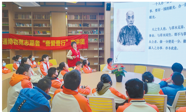
南通博物苑志愿者“善爱善行”宣讲团