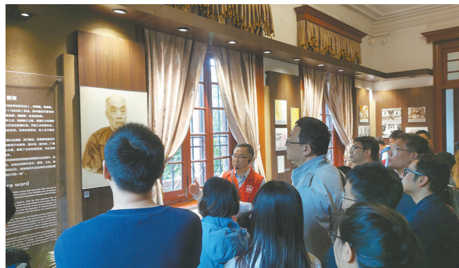
南通博物苑志愿者义务讲解