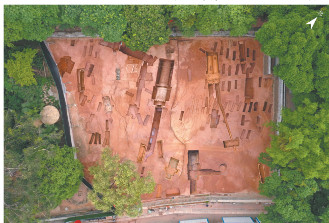
广州动物园麻鹰岗墓地航拍全景