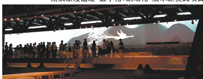
“倾听康陵”沉浸式艺术剧场现场表演