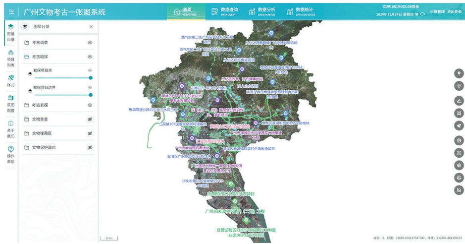
“广州文物考古一张图”页面展示