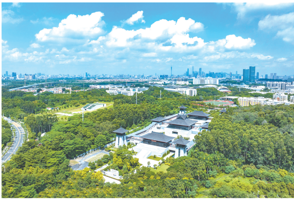
南汉二陵博物馆和康陵展区远景

广州文物工作者牢固树立保护与利用并重的理念，近年来，通过不断探索实践，在城市考古遗产保护与展示利用的工作上进展喜人。南越国官署遗址、南越国木构水闸遗址、广州动物园东汉墓、陂头岭遗址、广州动物园麻鹰岗东晋墓和南朝墓保护利用项目取得丰硕成果；“科技赋能 王官重现——南越王官署遗址展示利用项目”入选“全国考古遗址保护展示十佳案例”，“南汉康陵遗址剧场化展览新模式项目”入选“全国考古遗址保护展示优秀案例”，最大限度地保护文化遗产的精华，充分发挥考古遗存的社会功能，从而达到文物保护和城市建设的“双赢”效果。