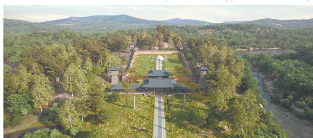
南汉康陵遗址“数字化+剧场化”展示新模式项目