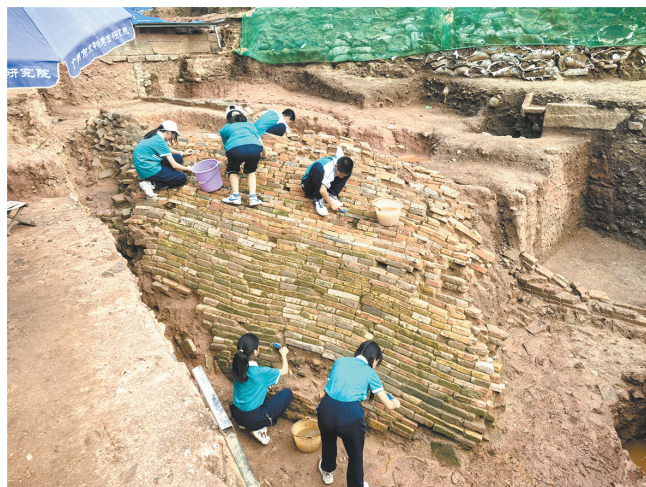
广州小马站—流水井古城遗址工地研学