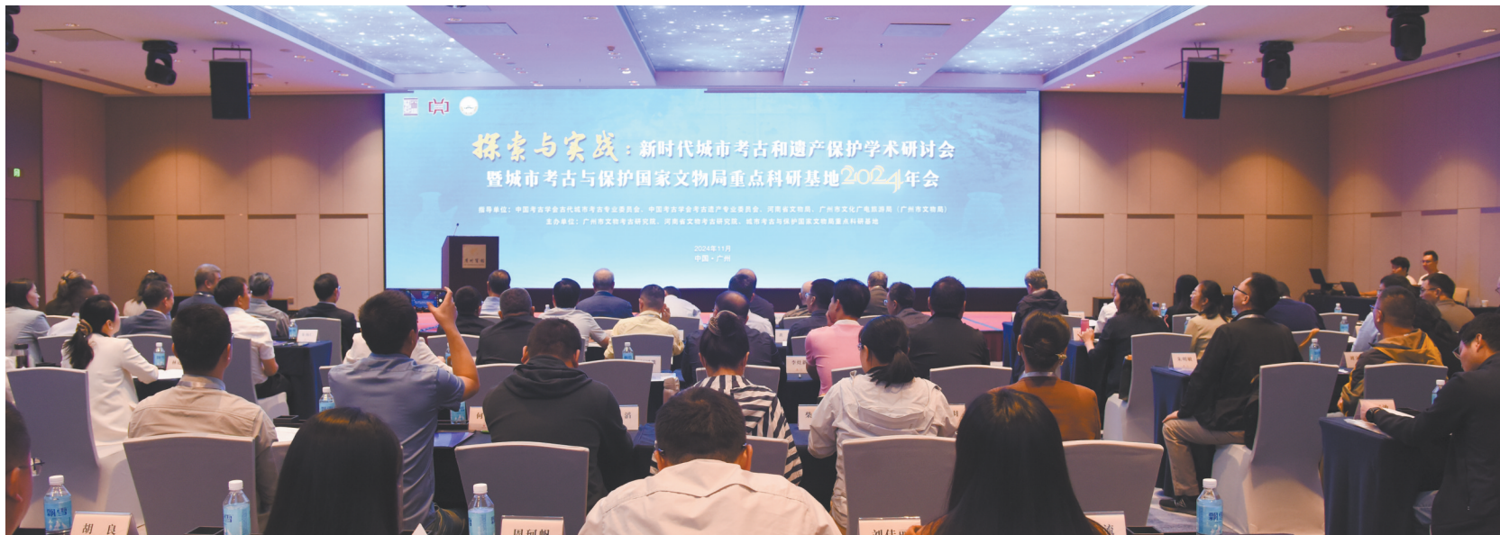
“探索与实践：新时代城市考古和遗产保护学术研讨会暨城市考古与保护国家文物局重点科研基地2024年会”会议现场