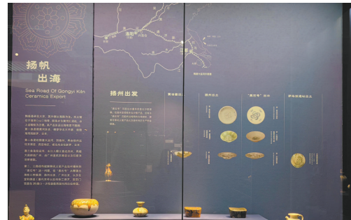
扬州博物馆藏巩义窑陶瓷器