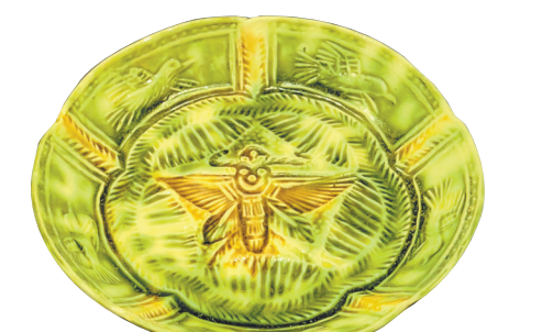
唐三彩盘 河南焦作至平顶山高速记水村项目出土 郑州市文物考古研究院藏