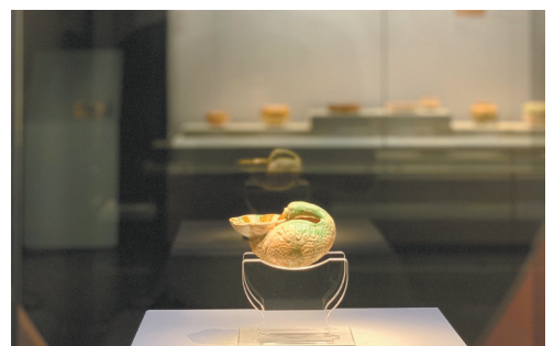
唐三彩鸭荷花杯 河南巩义芝田镇二电厂出土 巩义市博物馆藏

展览展期自2024年11月10日至2025年3月9日。(供稿:广州市文物考古研究院 执笔:王斯宇 许心影)