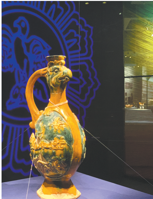
唐三彩凤首壶 河南永城唐墓出土 河南省文物考古研究院藏

11月10日,由河南省文物局、广州海上丝绸之路史迹保护和申报世界文化遗产工作领导小组办公室指导,广州市文化广电旅游局(文物局)、河南省文物考古研究院主办,广州市文物考古研究院、南汉二陵博物馆、海上丝绸之路(广州)文化遗产保护管理研究中心承办的“中原出海——巩义窑与海上丝绸之路”展览在南汉二陵博物馆正式开展。