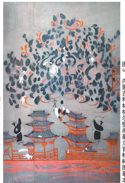
图3 内蒙古和林格尔壁画墓立官桂树图摹本

山东嘉祥武氏祠后壁楼阁图旁常见一棵大树，学人意识到它与楼阁相伴，一定不是普通的树，或据其枝桠相缠，考其为连理树；或据图像与升仙有关，考其为枣树；或据文献对当时居家前后所栽树种的记载，考其为桑树；或据树下有射鸟的形象，考其为扶桑树。2016年夏山东聊城九州苑小区汉墓画像石上，类似的大树上刻了清晰的榜题“桂树”（图1）。该树位于墓门立柱的最下层，枝桠相缠，无人射鸟（图2）。