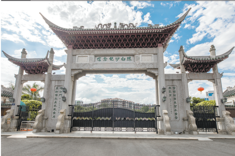
陈白沙纪念馆大门口