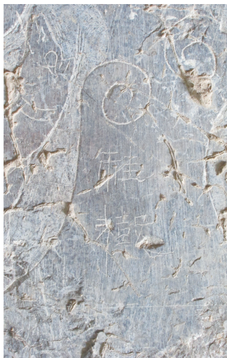
图1 聊城九州苑东汉墓门柱上的桂树榜题