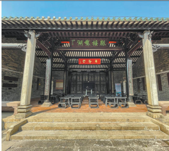
祠堂第二进——贞节堂

2008年秋，我第一次参观白沙祠。那时刚刚从内蒙古调到广东江门，对整个城市很陌生，想尽快熟悉。向一位同事请教，他建议我先去白沙祠看看，说这里是江门真正的文化源头。