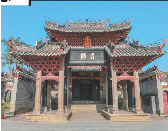
贞节牌坊及祠堂入口