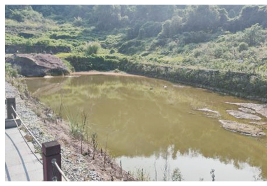
宋代石室墓M2，范家堰遗址建筑侧后墓葬应为北宋张宗范夫妻墓，遭严重破坏，其中M2为张宗范夫人墓，后壁阴刻“吉堂增福寿”五字，并出土瓷粉盒1件