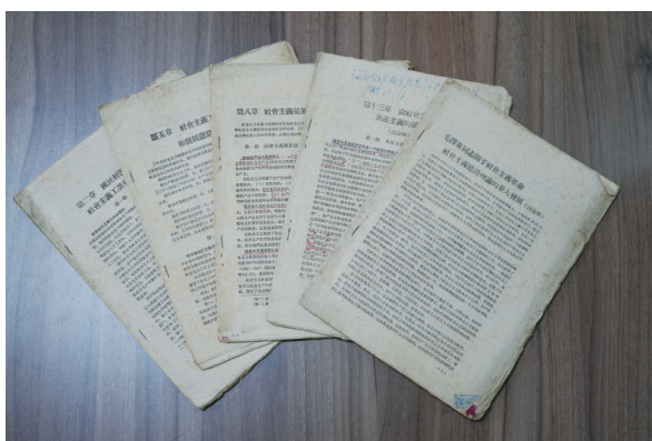
本次活动中纪念馆接收的捐赠文物

1939年11月7日，新四军江南指挥部在江苏溧阳水西村公开宣布成立，标志着新四军东进江南抗日进入一个新的发展阶段，对集中力量打击敌人、发展壮大抗日武装力量和根据地起到了重要作用，在中国抗战史上写下光辉的篇章。