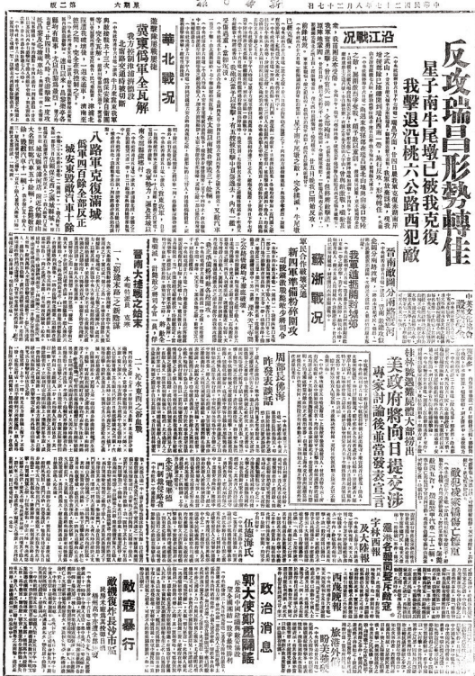
本次活动中纪念馆接收的捐赠文物

相关负责人表示，未来，纪念馆将全面深耕红色沃土、整合红色资源，不断充实教学实践软硬件设施，强化红色阵地干部教育功能，持续建强全省一流党性教育基地，奋力打造薪火相传的红色精神家园、有口皆碑的城市形象窗口。