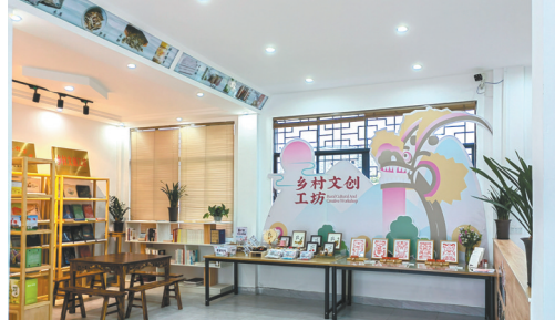
推进“乡村文创工坊”试点工作