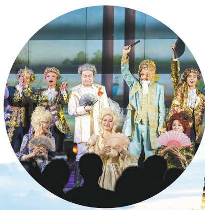
“岭南之夜”主题活动