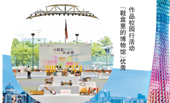
“鞋盒里的博物馆”优秀作品

新时代新征程,广东省博物馆在“五个粤博”的基础上守正创新,在探索构建立体博物馆,实现高质量发展的过程中走在全国前列。今后,广东省博物馆将一以贯之,赓续文明根脉,坚持以文化人,力争在推动文化繁荣、建设文化强国的征途上,谱写无愧于时代的新华章。