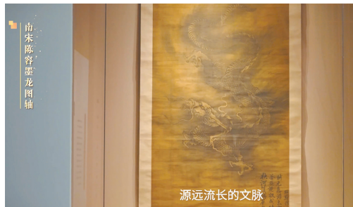
广东省博物馆宣传片画面