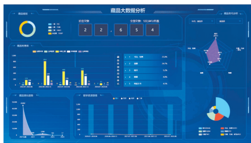
广东省博物馆数据融合分析展示平台