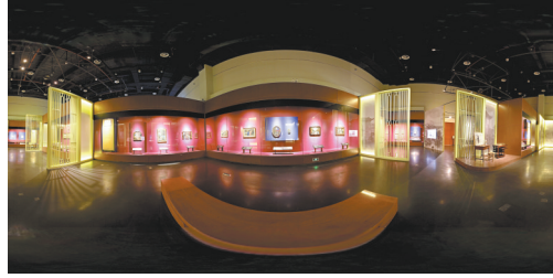
“焦点”展览虚拟展厅