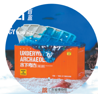
水下考古盲盒“粤博南海一号”