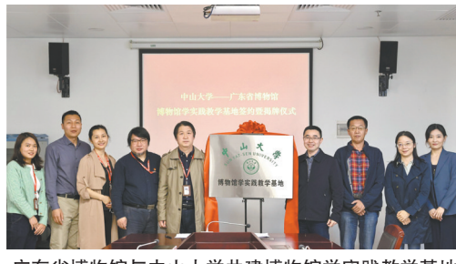
广东省博物馆与中山大学共建博物馆学实践教学基地