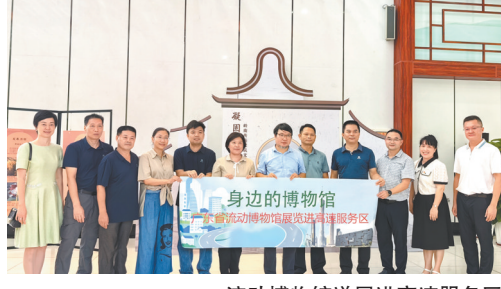
流动博物馆送展进高速服务区