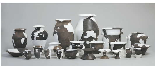
庙二晚期典型单位21 III H11出土陶器

统,综合推断狩猎采集经济在八里坪先民的生业经济中占据重要地位,山环水绕的山地环境对生业模式具有很强的塑造性。