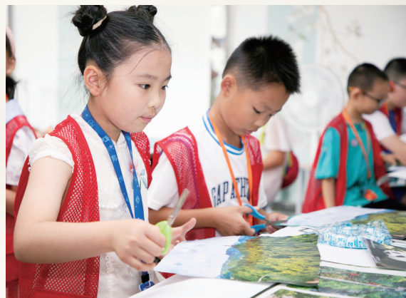
研学活动：学生设计制作蜀道相关海报