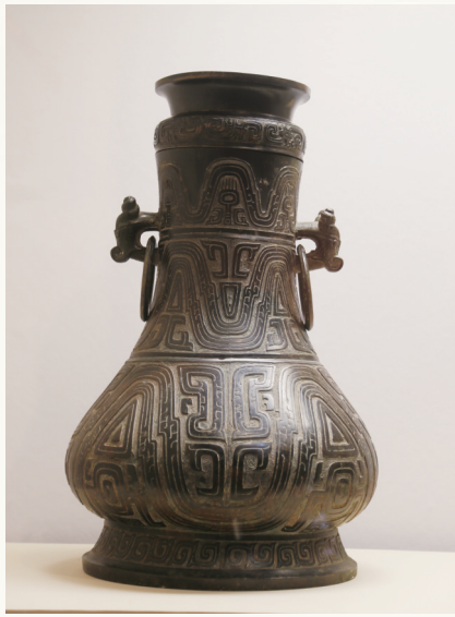
三年兴壶（宝鸡周原博物院藏）