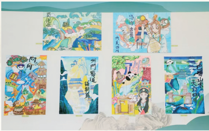
优秀学生作品展示