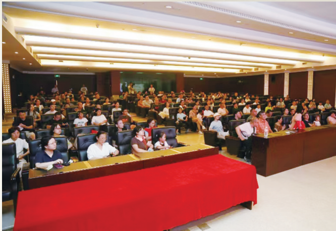
蜀道展系列公共讲座现场