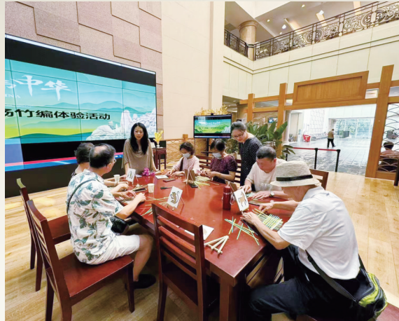
社教活动：竹编体验活动