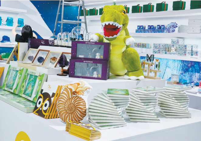
浙江自然博物院文创产品