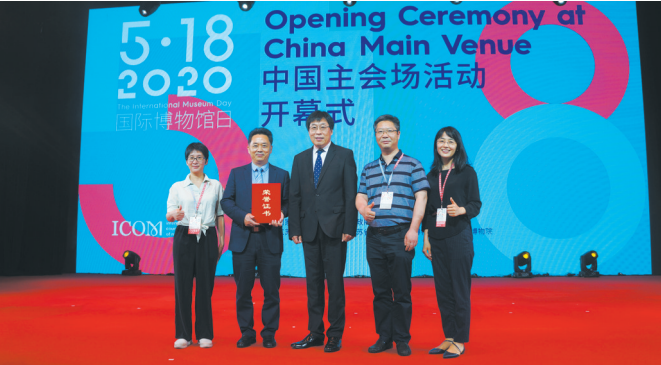
2020年“安吉馆基本陈列”获第十七届(2019年度)全国博物馆十大陈列展览精品