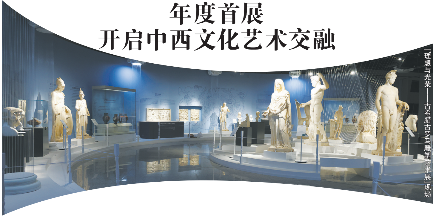
「理想与光荣——古希腊古罗马雕塑艺术展」现场

东西方雕塑艺术在发展中各有千秋，又有交流互鉴，为人类艺术史提供了诸多精美的作品。为了让观众近距离地感悟雕塑的美，由山西博物院和英国利物浦国家博物馆共同主办的“理想与光荣——古希腊古罗马雕塑艺术展”于2025年1月1日正式面向观众开放。