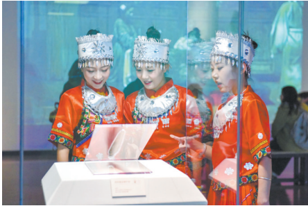
“巴从西南来——巴人的历史与文化特展”现场

为进一步增强观众对展览内容的了解，山西博物院创新推出线上有奖问答活动。观众只需扫描二维码即可参与答题，题目内容涵盖展览中的具体文物、蛇年文化等多个方面。成功答题的观众将有机会赢