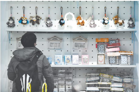
图册、首饰、文具、明信片、冰箱贴等展览配套文创