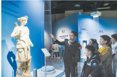
专业的展览讲解为观众导航

展览的空间设计严格遵循数学逻辑中的对称性与比例原则，运用错视技术，突破了传统空间的局限性。在设计过程中，汲取“纪念碑谷”游戏的极简主义灵感，提取古希腊古罗马标志性的圆弧形廊道、拱券结构、独特柱式以及三角形门楣等建筑元素，将展厅空间进行划分，使观众步入展厅时，仿佛瞬间穿越时空，置身于古典世界的氛围之