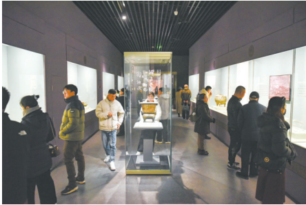
“变局——春秋时期的晋与秦”展览现场