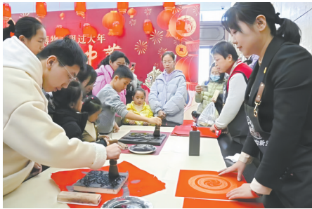
“木版年画印制”活动