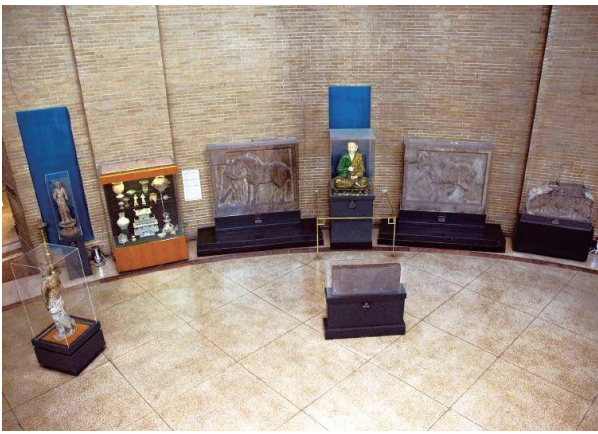
“飒露紫”“拳毛騧”二骏陈列在美国费城宾大博物馆展厅

早春时节，细柳飘丝，抚摸着亭角瓦片，即便没有晓风残月相伴，也叫人悠悠忘怀。问一声：丞相何在？所有的柳树桃树，都在小风中摇头摆手。但千年绵延的三里路，却记住了三位丞相宏远的生命，让他们成为三里路的历史证人，让人们常常流连青砖上的北宋时光。