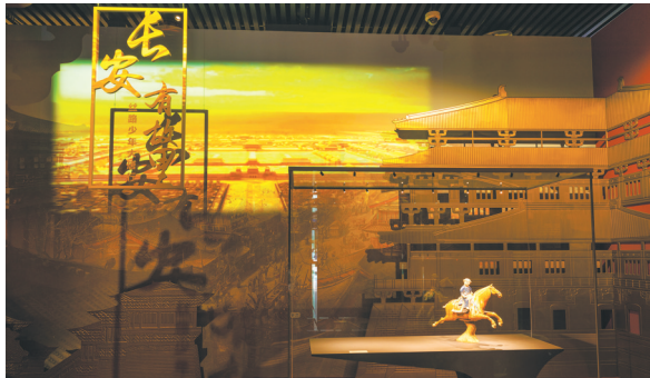
“长安有故里——丝路少年大唐行”展览