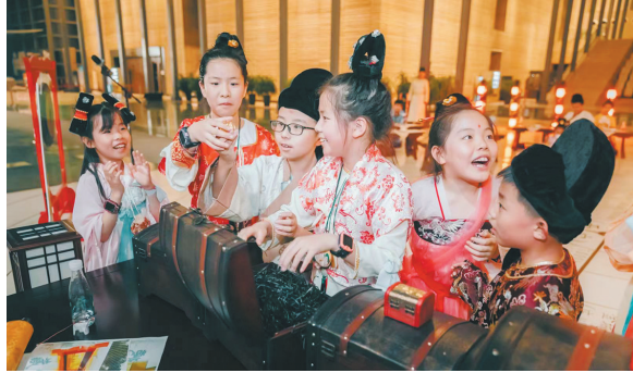
大唐西市博物馆举办西市奇妙夜活动