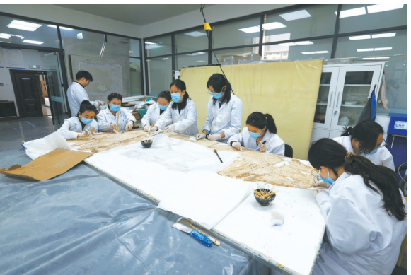
陕西历史博物馆壁画修复

先后出台藏品管理、文物数字化、库房建设、馆藏文物鉴定、文物科技保护等规范、标准、文件30多项。上线陕