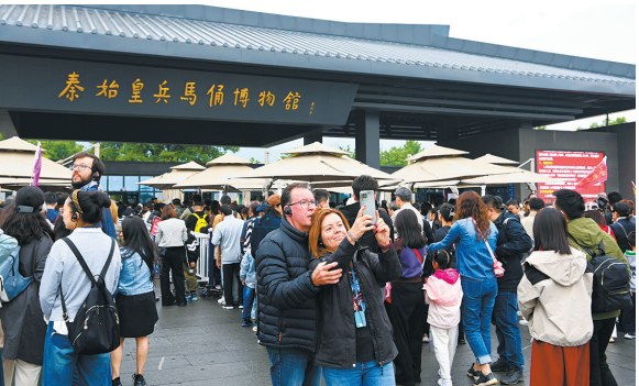
观众参观秦始皇帝陵博物院

扎实推进博物馆教育纳入国民教育体系,年均举办各类优秀文化“六进”活动上万场次。助力“双减”,健全馆校合作长效机制,与教育厅联合,开展“双师课堂”,在南门小学、大雁塔小学、陕西师范大学附属中学等挂牌“陕西省中小学文博素养培育基地”,切实推动博物馆与大中小学课程教育、社会实践活动、体验式教学等有机结合,把文博场馆变为“学习课堂”,把文物展品变为“学习教材”。