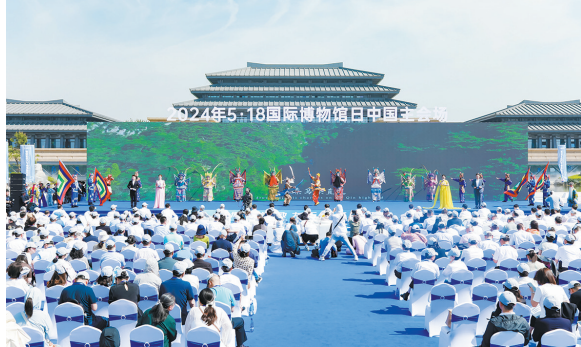
2024年5月18日国际博物馆日中国主场活动