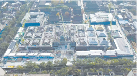
西安碑林改扩建项目鸟瞰图

各市(区)也做了一些积极的探索和尝试。西安市建设博物馆之城,出台支持行业博物馆和非国有博物馆发展的措施办法。延安市以国家文物保护利用示范区建设为契机,建设革命博物馆之城。宝鸡市出台博物馆之城建设的指导意见,突出历史文化和工业遗产保护利用。同时,按照“统筹布局、科学规划、重点突出、分步实施”原则,积极稳妥推进博物馆建设。