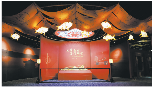
“大唐盛世 法门珍宝——唐代文化精品特展”在福建博物院巡展