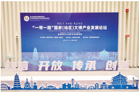
“一带一路”国家(地区)文博产业发展论坛

品供给,深化交流合作,持续把博物馆建设成公共文化服务的阵地、优秀文化传承的阵地、先进思想引领的阵地、中华文明传播的阵地,扎实推动陕西特色、中国风格、世界一流的博物馆创建,为助力文化强国建设、奋力谱写陕西高质量发展新篇章贡献力量。