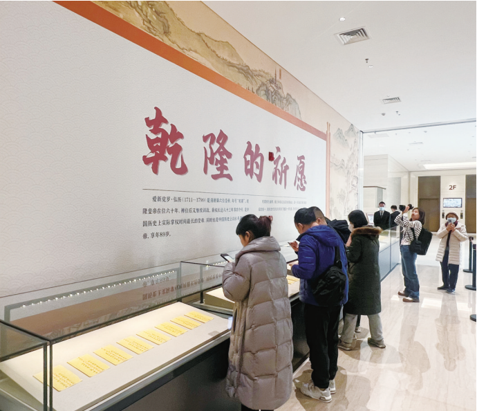
观众驻足观看“乾隆的祈愿”特展