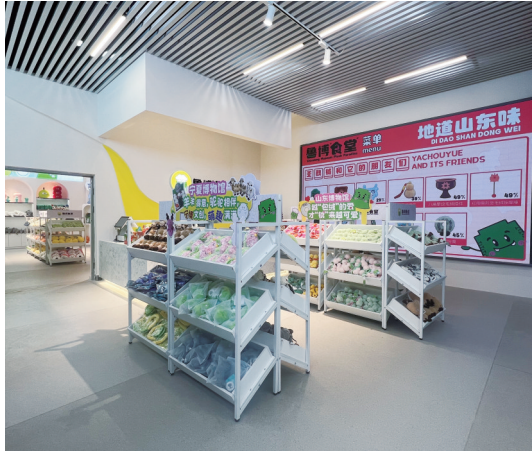
“鲁博食堂”文创空间

博物馆不仅是文物的收藏之地，更应是文化传承与创新的关键平台。黄河流域博物馆联盟各成员单位将开展紧密合作，共同探讨多元发展路径，激发创意火花，共同挖掘阐释黄河文化，讲好新时代黄河故事。