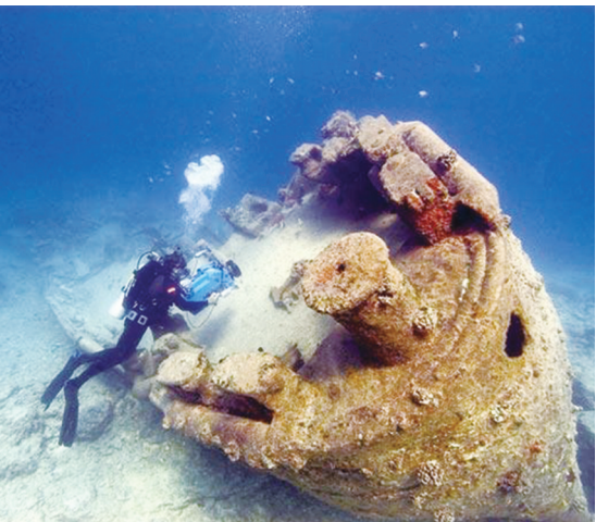
帕帕哈瑙莫夸基亚海洋保护区

帕帕哈瑙莫夸基亚基于深海生物和夏威夷土著文化习俗的突出普遍价值，于2010年列入《世界遗产名录》，包含沉船、灯塔、土著居民生活遗迹与活态遗产等。它是美国最大的海洋保护区，也是世界最大海洋保护区之一，由美国渔业与野生动植物局、国家海洋与大气管理局、夏威夷土地与自然资源局共同管理。2000年，美国总统克林顿依据《古物法》的规定设立了面积约34万平方千米的西北夏威夷群岛珊瑚礁生态系统养护区，2006年被重新规划为帕帕哈瑙莫夸基亚海洋保护区，涵盖区域内自然与文化资源的保护管理，面积达36.2万平方千米，并实现了对整个保护区的完全性保护。列入《世界遗产名录》后，禁止在保护区附近海域进行商业捕捞和资源开采活动，以满足水下文化遗产保护的需要。