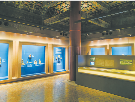
文华殿“警若香山：陀陀罗艺术展”展厅一瞥

（本文得到故宫博物院 2023 年度科研课题“古建筑展厅环境下的展柜设计与使用研究<KT202306>”经费资助）