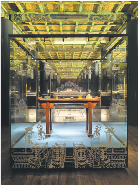
午门“大道之行——儒家文化特展”展厅一瞥

故宫所承载的中华优秀传统文化集合了我国古代不同时期、不同地域、不同民族、不同主题的文化精粹，其中就包括中国人为政以德的政治理念、求同存异、和而不同的和合精神，这些都是儒家思想的重要内容，蕴藏着解决当代人类面临难题的重要启示。2024 年是孔子 2575 周年诞辰，为增强中华民族凝聚力和中华文化影响力，推动儒学及优秀传统文化的研究与传播，故宫博物院、国际儒学联合会共同主办了“大道之行——儒家文化特展”，展览以