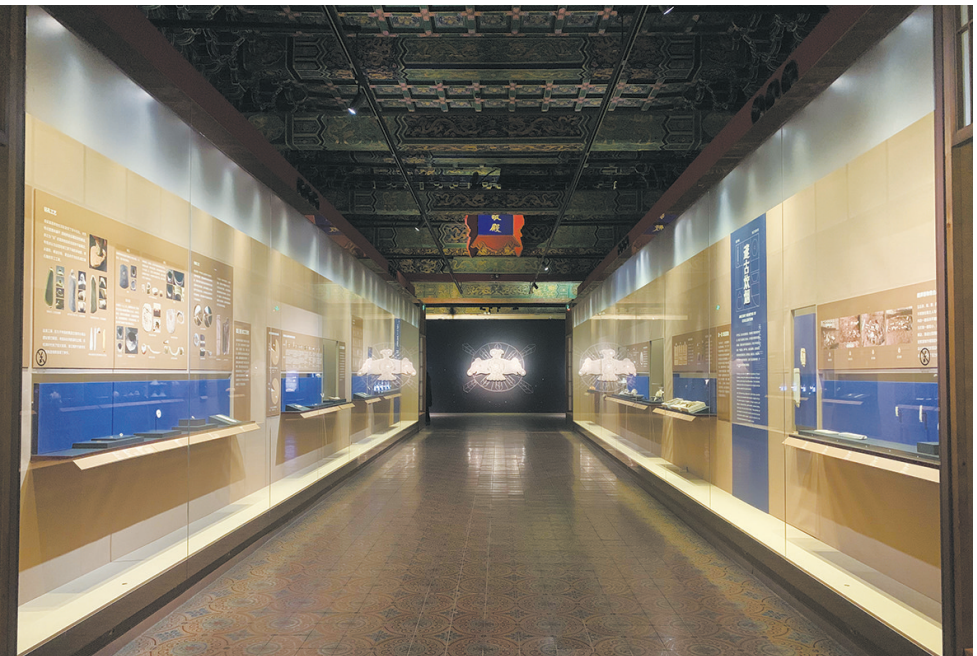
文华殿“文明先锋——凌家滩文化玉器展”展厅一瞥