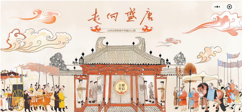
“走向盛唐”数字展首屏

墓葬壁画中的元素进行数字化再创作，以手绘长卷的方式再现北朝社会生活场景；四是“丹青妙笔”，以北朝画师为原型设定画家，通过画家讲述北朝绘画技法，展现北朝壁画的艺术风采；五是“精神世界”，以动画形式再现北朝人丰富的内心世界；六是“尾篇视频”，概括北朝的融合特征，点出这一时代对隋唐盛世的奠定作用。