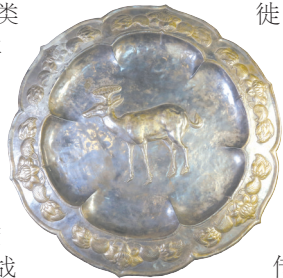
鎏金芝鹿纹三足银盘 唐代 河北博物院藏

第二部分北方民族的交流融合，分为“长城修建 南北交往”“拓跋肇兴 一体共融”“隋唐繁荣 同一家”三个单元，主要体现了战国至隋唐时期长城地带民族交流与融合，各民族间持续的互动与交融促进了中华民族多元一体格局的形