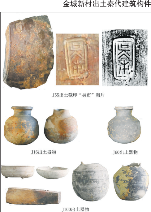
混堂巷北出土秦代器物

与“富民家丞”封泥共出的田姓私印可证史事。考古实物与文献之间的互证，使我们倾向于将二号墓园墓主推定为西汉富民侯田千秋及其夫人。