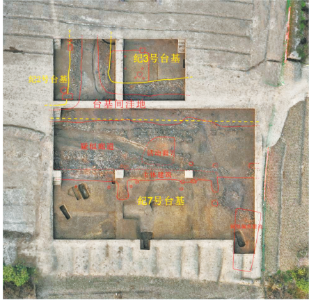
纪7号、纪2号、纪3号台基及相关遗迹分布图

（湖北省文物考古研究院 荆州纪南生态文化旅游区文物局 执笔：闻磊 李卓 黄芑南 黄强）