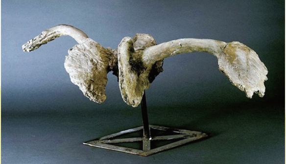
河套中国大角鹿化石