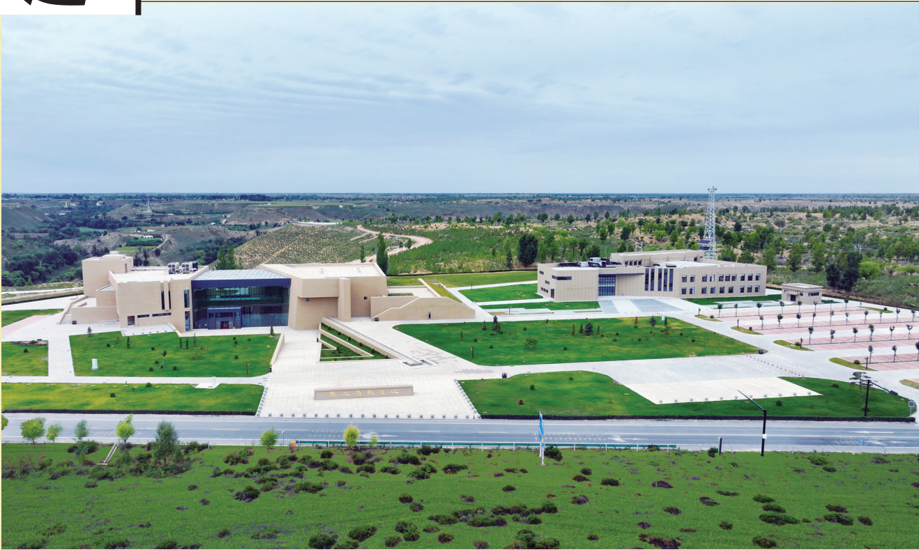
萨拉乌苏遗址博物馆与河套人文化研究中心