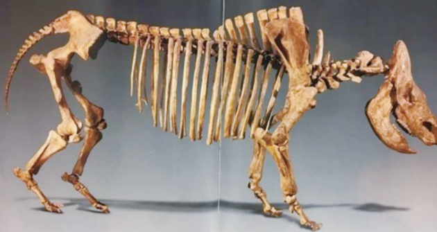
萨拉乌苏发现披毛犀化石

环境物语： 以第四纪地质地貌剖析，重现远古萨拉乌苏动植物生态。利用较大较高空间及立面墙，制作萨拉乌苏大型代表性地质剖面，直观呈现萨拉乌苏地区第四纪地层序列，辅之以河流凹凸岸面貌、河湖相沉积、冻融褶皱等模型，以及萨拉乌苏古动物化石和动物群栖息大场景，揭示河套人生活的萨拉乌苏地理环境及生存状态。