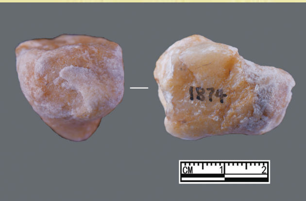
邵家沟湾遗址出土石锤