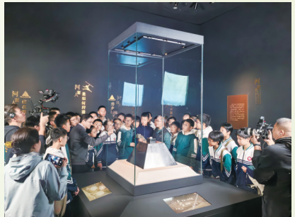
“博望东西 | 萨拉乌苏的文化之旅”活动