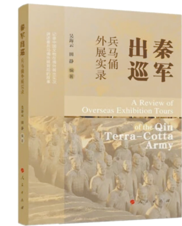
《秦军出巡——兵马俑外展实录》

总之，《秦军出巡——兵马俑外展实录》是一本具有档案性质的专题工具书，资料翔实，文图并茂，通过对兵马俑历次外展的全过程记载，不仅有利于研究阐释秦陵秦俑文物内涵与价值，更有助于了解兵马俑外展在中外文化交流、讲好中国故事方面发挥的重要作用。