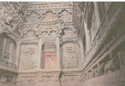
稷山金墓1号墓北壁

偶尔坪遗址位于山西省榆社县河峪乡西周村西的冲沟台地上，处于太行山中段西麓，古为北上党地区北端门户。已发掘出的遗迹有灰坑、灰沟、小型墓葬、灰坑葬、陶窑、土坑灶、地下建筑基址及地上夯土基址、部分夯土城墙等，时代从战国早期延续到战国晚期。其中，建筑基址和夯土基址是此次发掘中最重要的发现。夯土基址共发掘4座，位于发掘区西部，主要残存地下部分。石砌建筑3座，建造方法是在长方形土圻内用河卵石垒砌石墙和积石基础。木构建筑1座，在长方形土圻内中部起建，