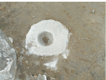
偏关天峰坪遗址出土柱础石(门轴石)