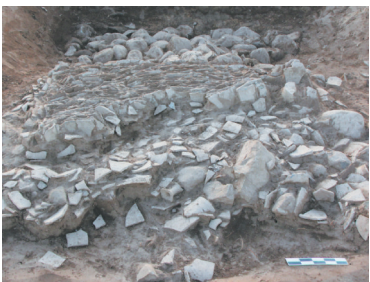
榆社县偶尔坪遗址路面