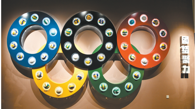
团结聚力——签名排球墙