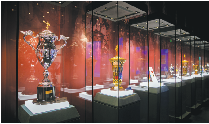
“十次冠军”奖杯、奖牌