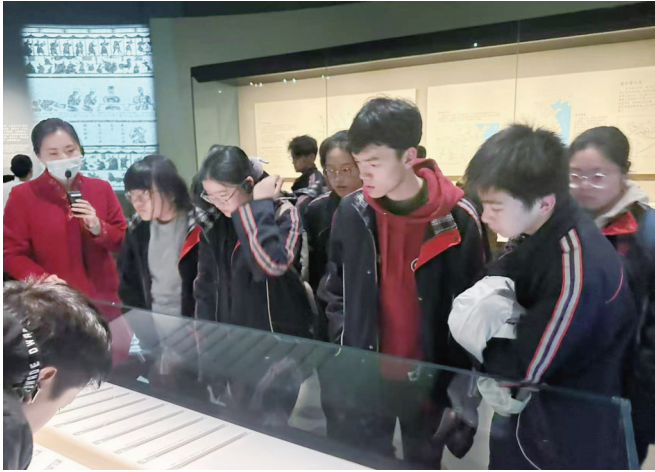
人工讲解持续升温

在文旅融合的时代浪潮下,“博物馆热”持续升温。3月份,湖北省博物馆当月观众接待量达到52万人次,其中年轻观众占比超过60%。如今,观众对博物馆的各项体验需求日益提高。讲解是观众读懂文物,理解博物馆的“刚需”。一些热门博物馆,不但一票难求,讲解也因难以预约而成为吐槽的对象。