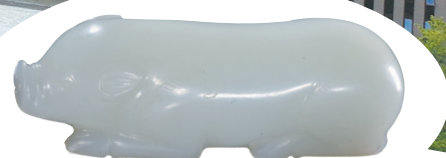
和田羊脂白玉猪握 三国时期

汉水是“江河淮汉”四渎之一，流经长江流域中游与黄河流域中游之间的过渡地带。襄阳位于汉水流域中心，是中国自然地理中心的枢纽性城邑，“西通关陕，东连吴会，北控宛洛，南达湘黔”，历来为兵家必争之地，更是文化交流传播、经济互惠流通之胜地，有“三千里汉江，精要在襄阳”之说。