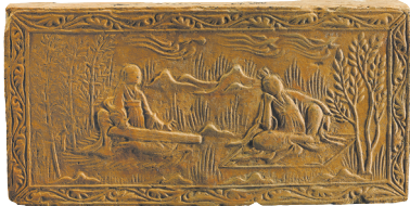
“高山流水”画像砖 南北朝

为了彰显中华文明连续性、创新性、统一性、包容性、和平性，讲述南北文化在襄阳地区交往交流交融，襄阳市博物馆新馆打造了基本陈列“江山留胜迹——襄阳古代历史文化展”，展示襄阳独树一帜的历史文化和重要历史地位。新馆基本陈列面积达6300平方米，以襄阳籍唐代诗人孟浩然的诗句为主题，以历史发展为主线，展出精品文物4000余件，种类齐全，涵盖金属、陶瓷、砖瓦、漆木、玉石骨蚌、纸质、壁画等，其中93%以上源自考古出土。自2024年5月16日新馆开放以来，展览深受社会各界好评，重塑了襄阳“凝望过去、连接现实、通往未来”的桥梁。