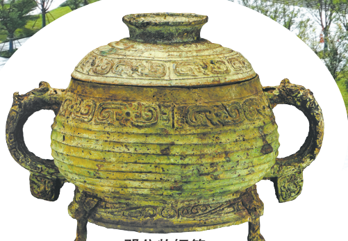
邓公牧铜簋 西周晚期