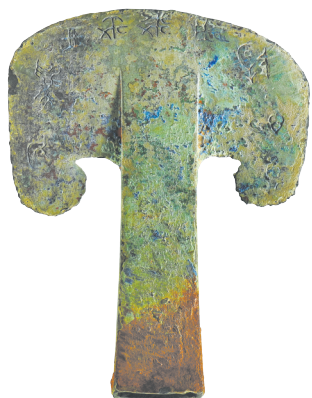
“曾伯陪”铜钺 西周晚期