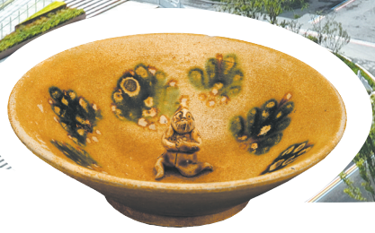
长沙窑绿彩胡人瓷碗 唐代