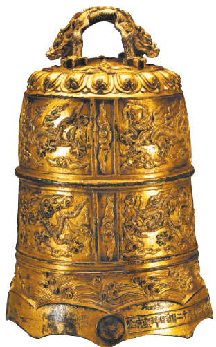
云龙纹鎏金铜钟 明代