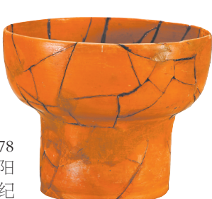
曲腹红陶杯 新石器时期

第三部分“六合同风 襄汉重光”展示了秦汉时期的襄阳。公元前278年，白起拔郢，襄阳地区提前半个世纪进入一轨同风的秦国统治，秦楚文化融合，形成了独具特色的楚风秦韵风格。在汉代大一统的发展中，“襄阳县”“樊城”分别于西汉中晚期、东汉中期见载于史册。这一时期，襄阳实现了从津渡到县