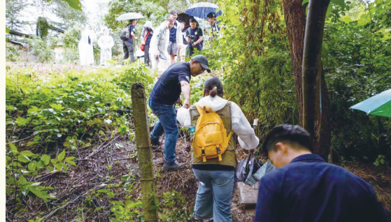
陕西师范大学师生在调查途中