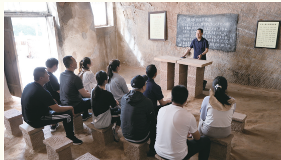
在志丹红大教室举行微党课活动