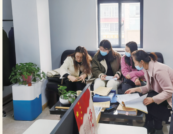
西安建筑科技大学师生在西安钟楼书店调查