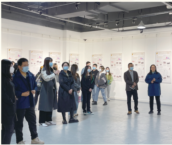
西安美术学院师生在参观“为有源头活水来——陕西省不可移动革命文物专项调查展”

专门开辟“思政课堂搬进革命旧址”专栏，组织参与调查的高校师生结合调查经历，撰写心得体会。陕西师范大学在“陕西师大历史文化学院”微信公众号开辟“革命文物调查献礼建党百年”专栏，推送调查同学们撰写的革命文物调查日志。心得体会与调查日志真实记录同学们调查工作中的见闻、感受和思考，同学们用“长知识、悟精神、做贡献”形容自己的调查经历，通过日志能够看到同学们每一处调查都是一次与革命先辈的对话，体会到了同学们对革命先辈的敬仰和缅怀、对今天幸福生活的珍惜与热爱。此外，各高校同学通过调查掌握了一手资料，完成了学位论文14篇，发布微视频18部。将革命文物与学业有机结合起来，丰富了工作成果。