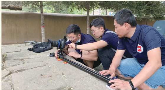
西安理工大学团队在调查工作中