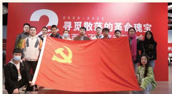
在陕西师范大学举办的“寻觅散落的革命瑰宝——陕西省不可移动革命文物专项调查成果展”