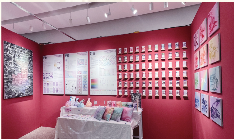
西安美术学院以革命文物为主题的毕业设计展