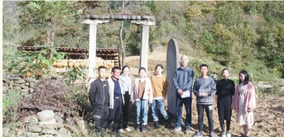
西北大学师生在疙瘩庙红二十五军战斗遗址调研